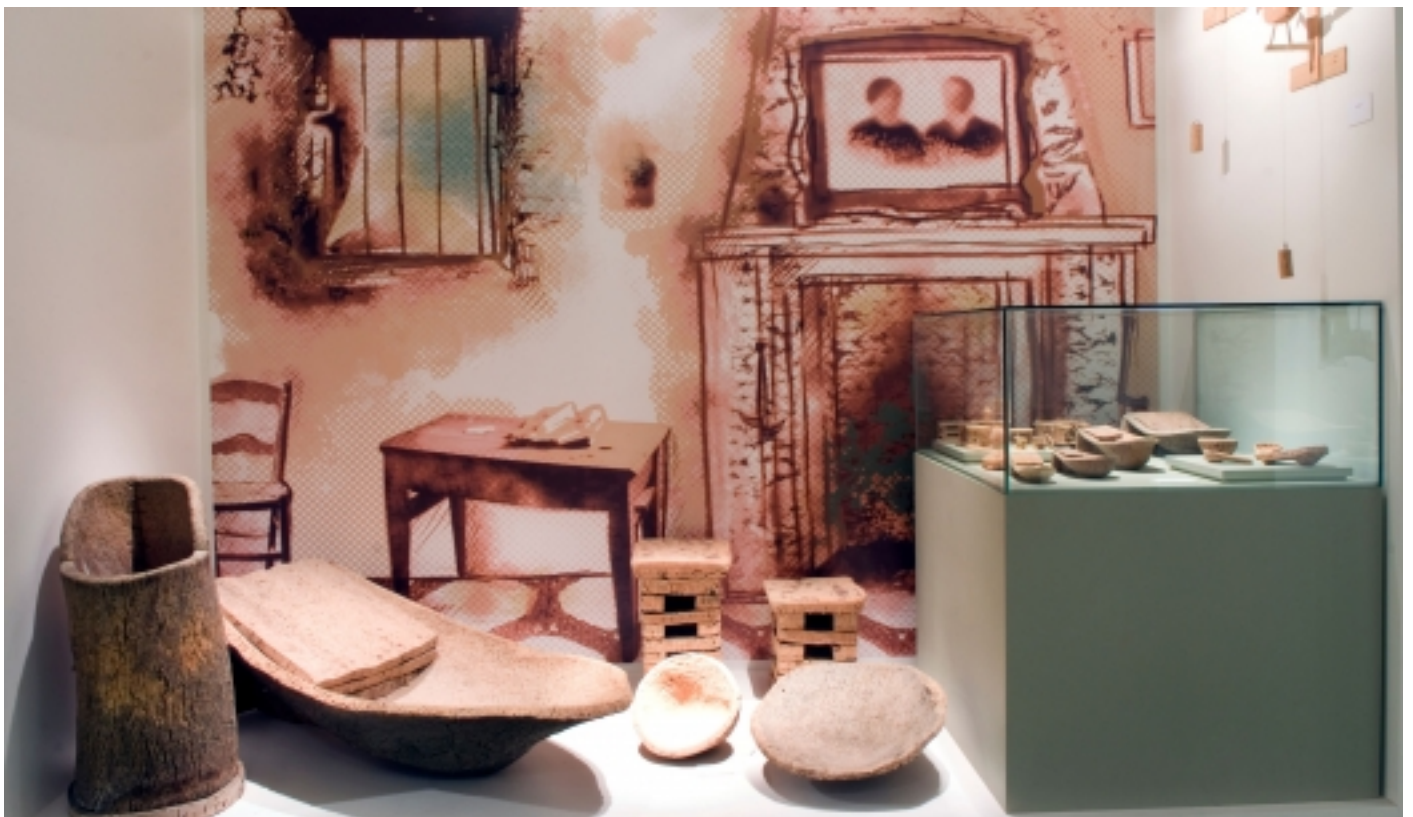
El suro a la llar.

A partir d'aquí ja ens endinsem a la preparació i transformació del suro, des de la pela, passant per la fàbrica, fins a l'elaboració del tap, els diferents tipus i usos.