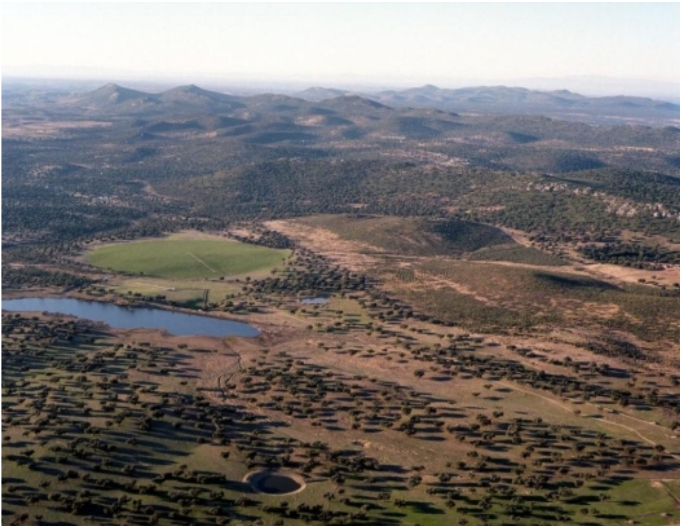
Sierra de San Pedro, San Vicente de Alcántara.

Al nord trobem els rius Tajo i Salor, i pròxim al límit nord oest discorre el riu Ayuela. Cap al sud el relleu es suavitza cada cop més, fins acabar d'una manera brusca per la interrupció d'una falla.