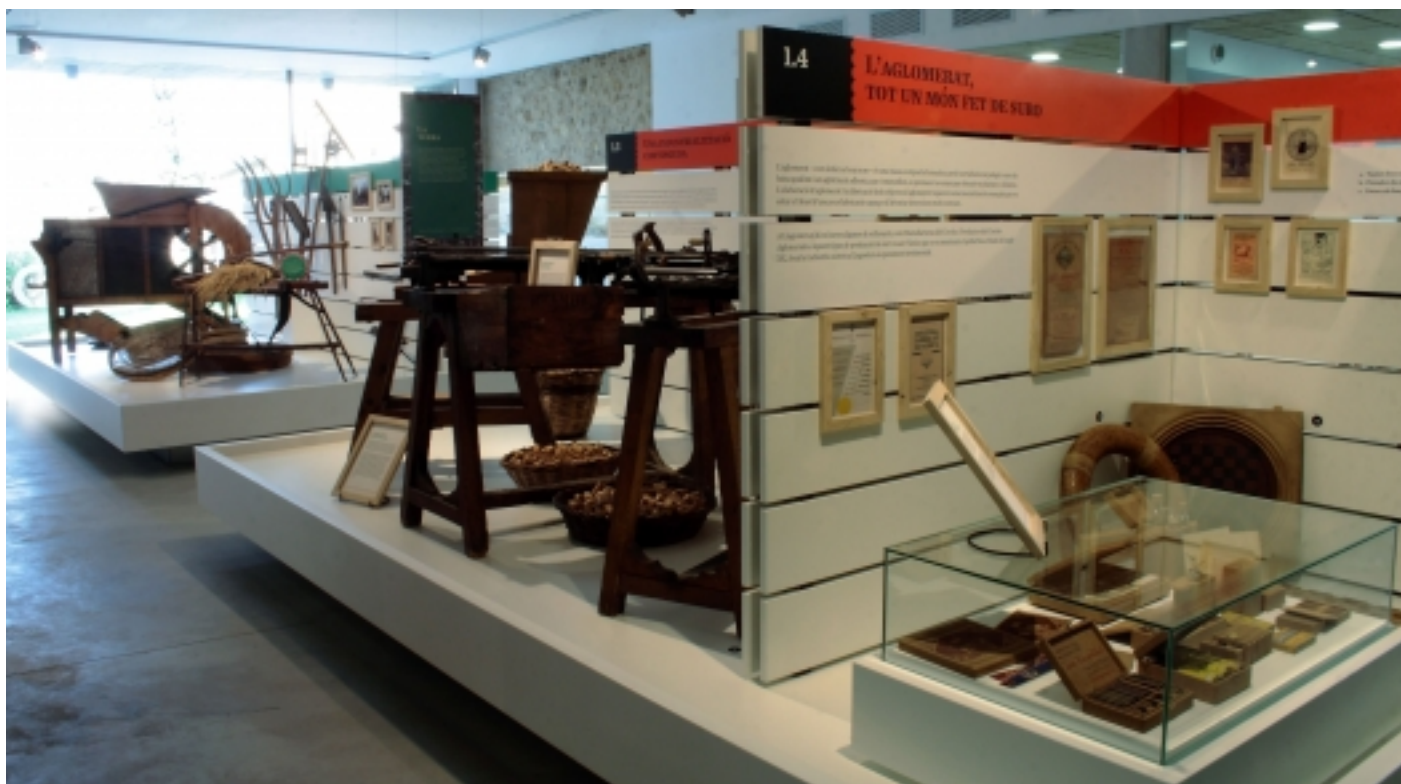
Espai expositiu amb part dels àmbits de El suro i La terra. Foto: Quim Paredes

Font: Informació facilitada pel Centre d'Interpretació Can Caciques.