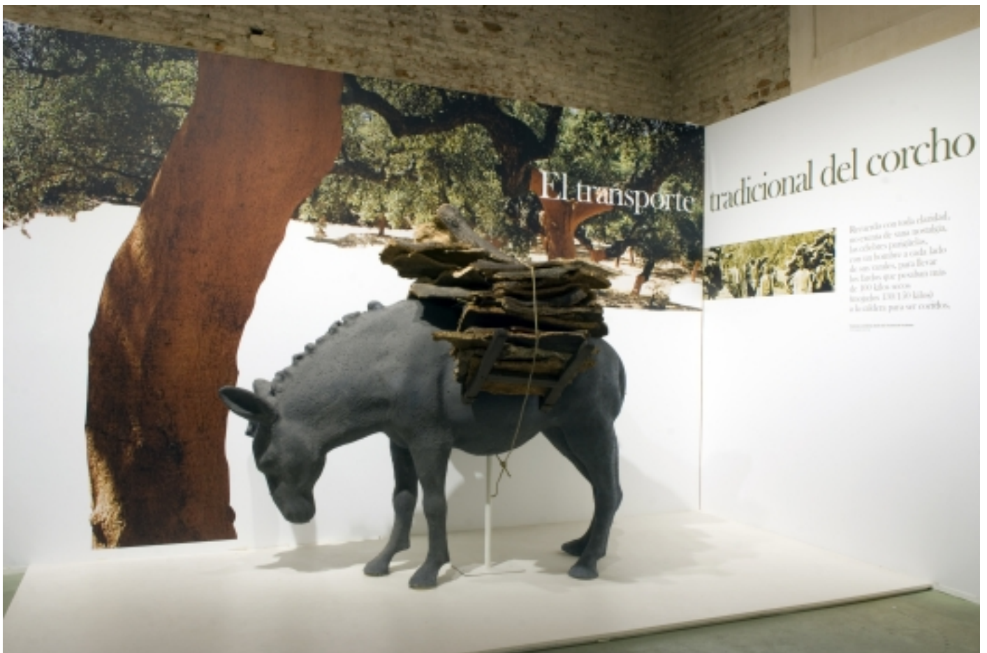
Museu d'Identitat del Suro, San Vicente de Alcántara.

A través d'aquests equipaments podrem conèixer millor la realitat d'aquesta cultura i el que comporta el seu paisatge i activitat quotidiana.