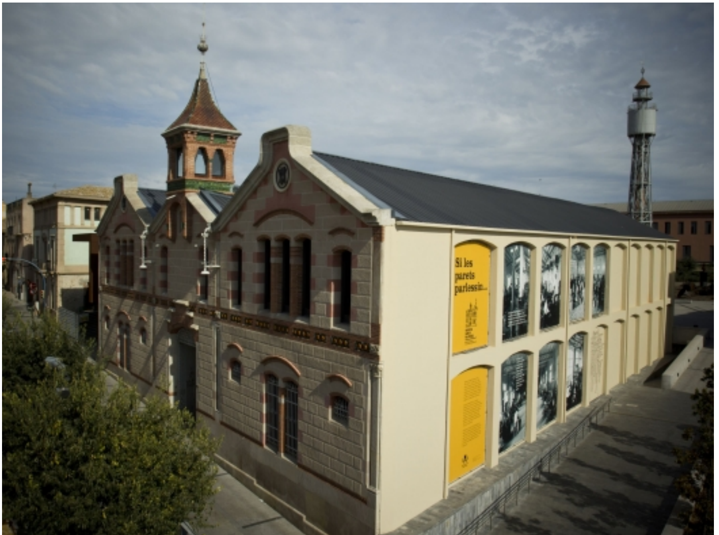
Museu del Suro, Palàfrugell.

El Museu tracta el suro des del punt de vista científic, tècnic, industrial, artístic i cultural, de forma ambiental i interactiva. Actualment disposa d'una exposició provisional sobre la pela del suro, la transformació industrial i la història de l'empresa Manufacturas de Corcho, a més d'un espai interactiu sobre les propietats d'aquest material. Disposa d'un espai didàctic, sala d'exposicions temporals i un auditori per a més de 100 persones.