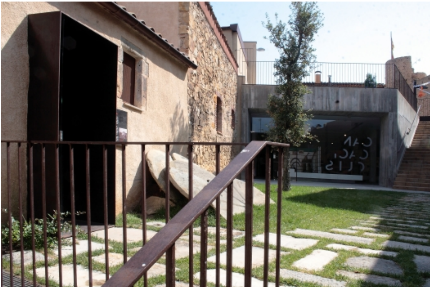
Pati central entre la casa pròpiament anomenada Can Caciques i el nou edifici.

El Centre d'Interpretació Can Caciques és un equipament dinàmic i actiu que convida al visitant a descobrir les característiques més significatives del passat de Llagostera . S'ubica a Can Caciques, una casa construïda aprofitant una de les torres de la muralla medieval del segle XIV.