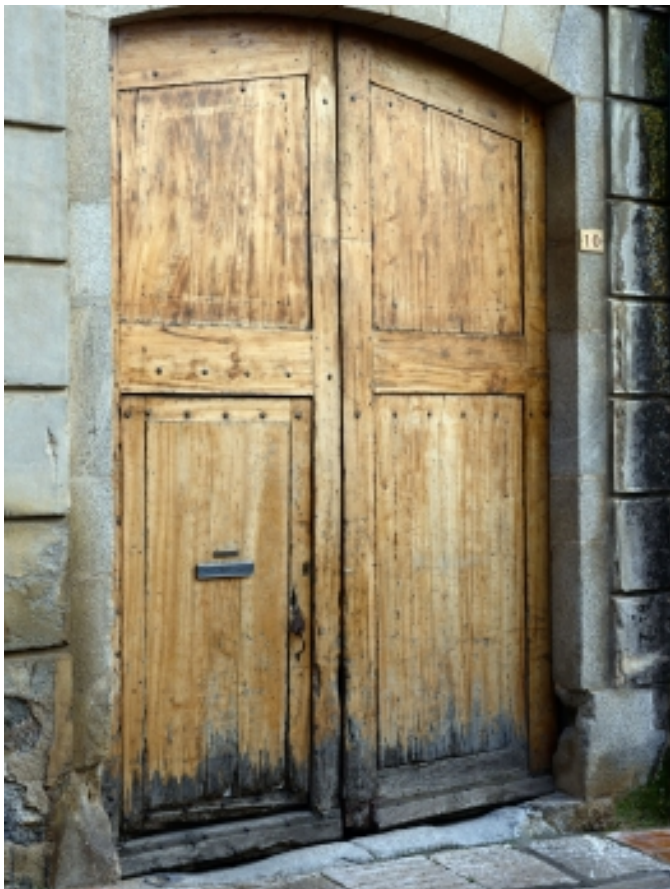
Porta original de l'antiga fàbrica de Can Bech, Agullana.

En relació al patrimoni cultural, visiteu la Sala d'exposició permanent de la necròpolis de Can Bech de Baix , nom que rep el jaciment del Bronze Final ubicat al terme municipal d'Agullana, i on podreu conèixer tot el trobat a les últimes excavacions i tasques d'investigació l'any 1973.