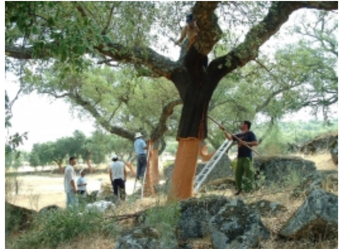
La pela del suro, San Vicente de Alcántara.

Un gran atractiu turístic és que, a finals de l'estiu, es pot començar a sentir la brama dels molts cérvols que habiten en aquest enclavament. Si sou amants de les marxes a peu, la bicicleta de muntanya, el cavall o inclús els vehicles motoritzats, a San Vicente trobareu una infininitat de rutes.