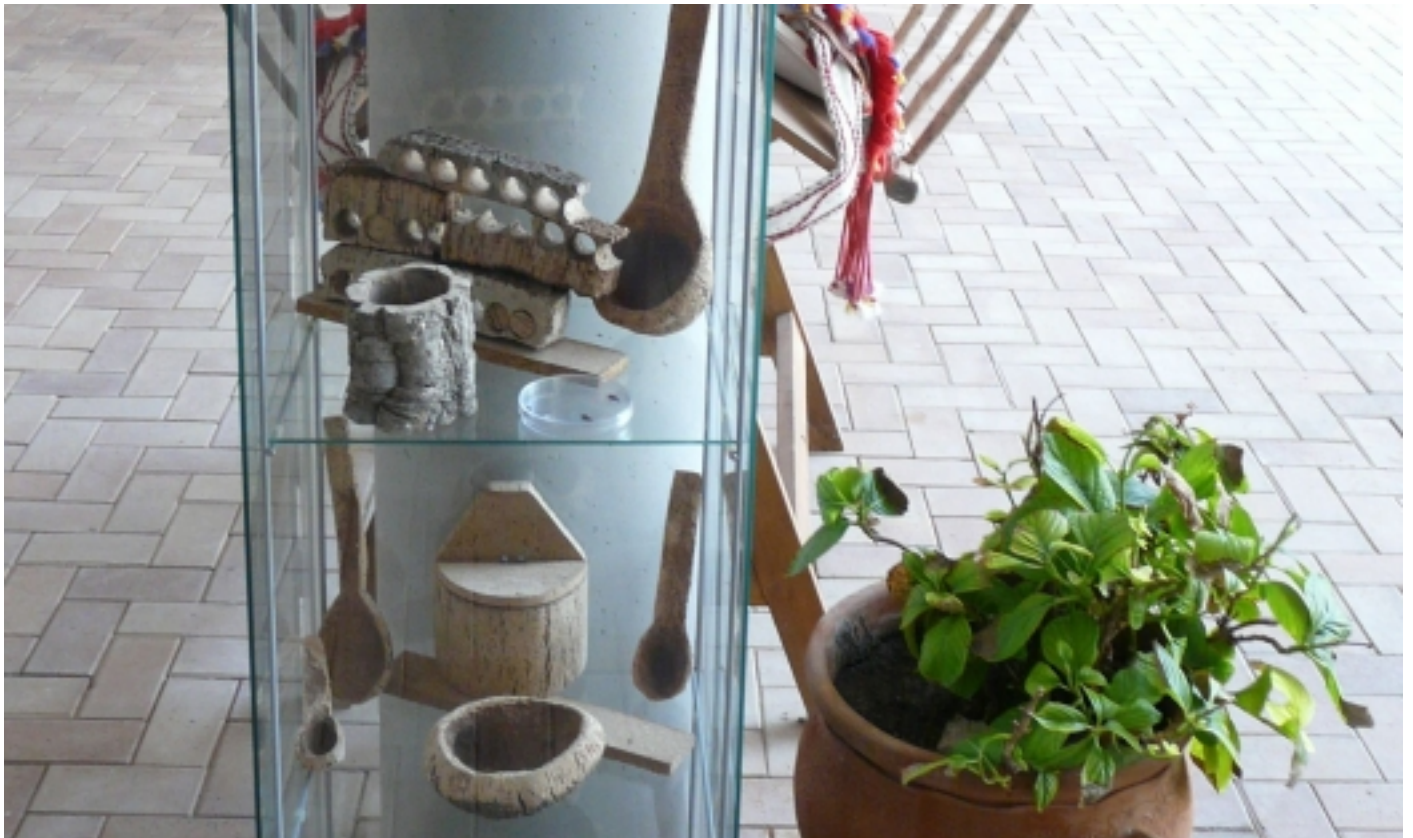
Exposició d'objectes de suro.