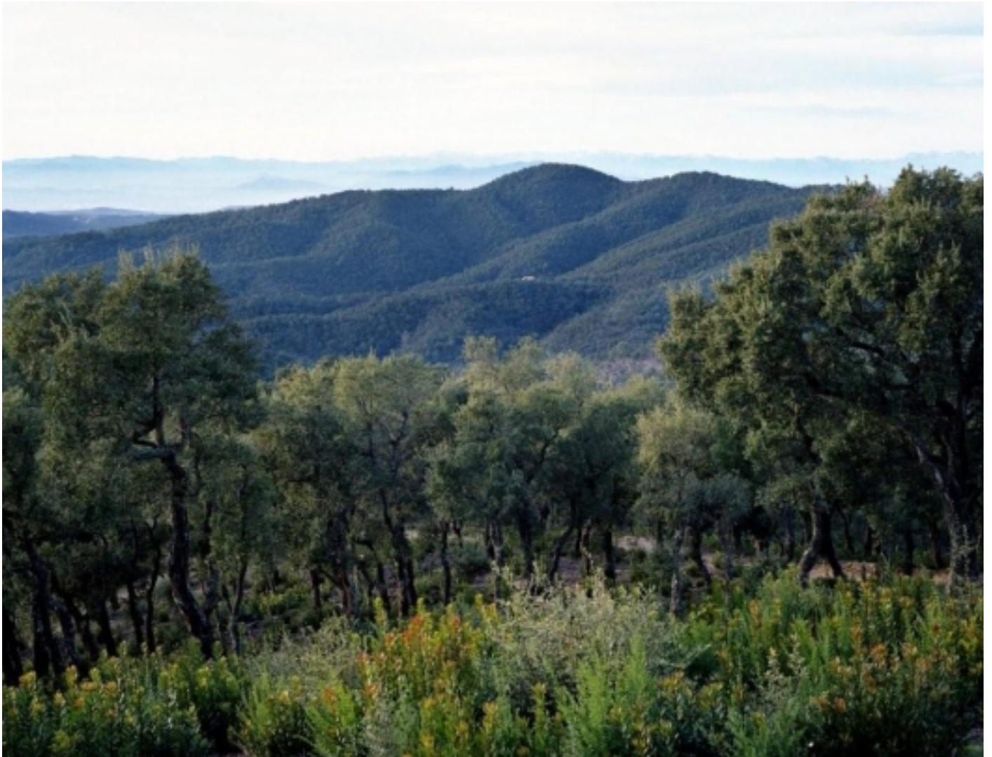
Les Gavarres, Romanyà de la Selva.

Constitueix una veritable barrera física entre el Baix Empordà i la Selva , essent el seu pic més alt el Puig de la Gavarra, de 532 metres d'alçada, seguit pel Puig d'Arques, amb 527 metres.