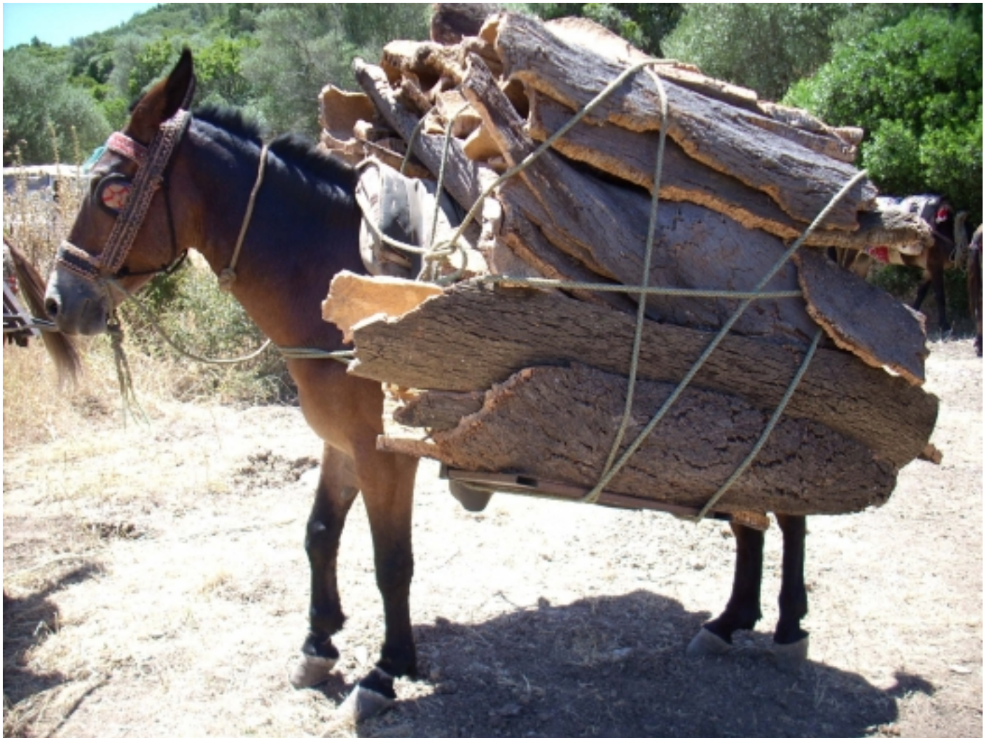
La traginaria.