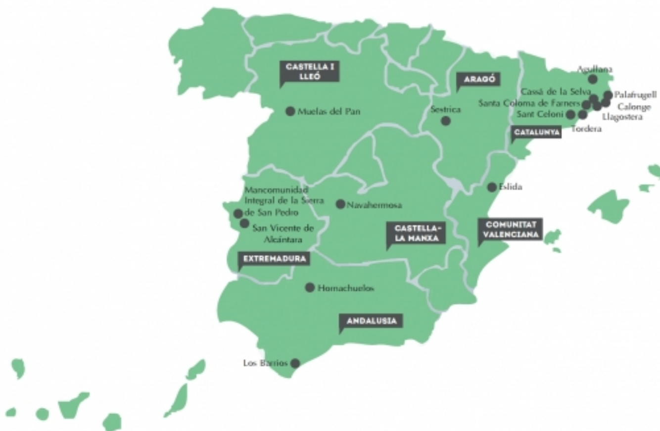
Municipis surers membres de RETECORK

Aquest projecte pretén fomentar el desenvolupament local dels territoris surers i la sensibilització sobre la importància i singularitat del seu patrimoni natural i cultural mitjançant la valorització turística.