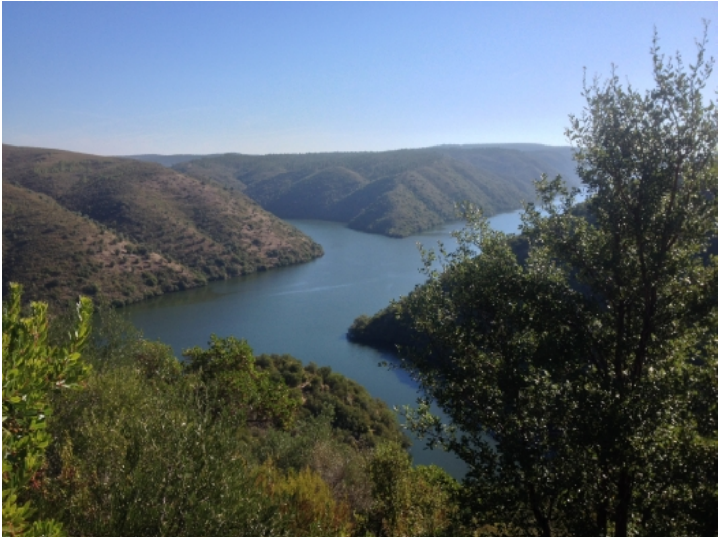
Mirador de la Carrasquera, Cedillo.

Fou declarat el 7 de juliol de 2006 i gran part de la seva superfície coincideix amb els espais declarats Zona d'Especial Protecció per les Aus (ZEPA) i Lloc d'Importància Comunitària (LIC).