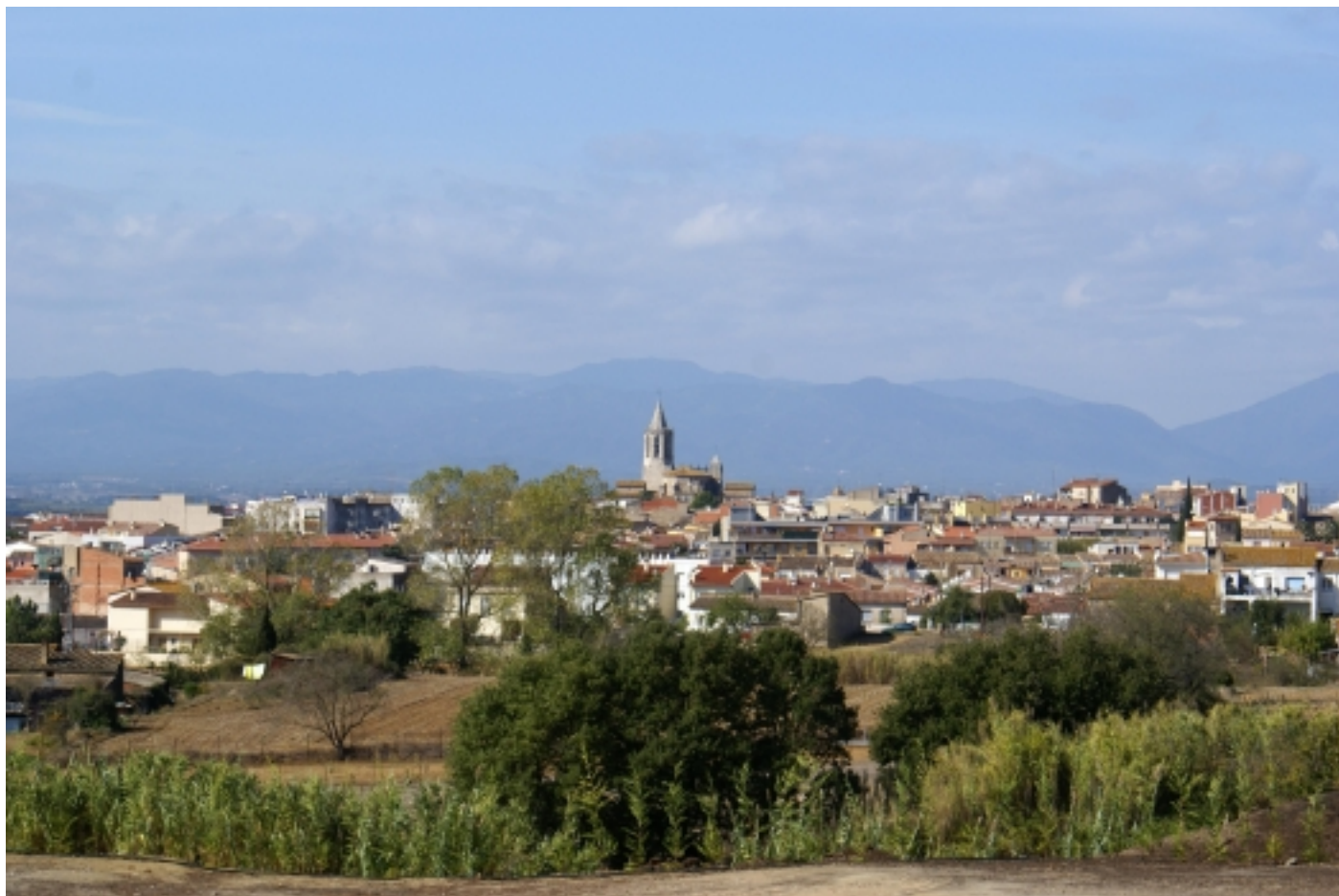
Cassà de la Selva.

La muntanya , que en temps passats fou una zona d'intens treball ramader i forestal és, avui dia, espai d'oci habitual per habitants i visitants, ja sigui amb activitats tradicionals com la caça o la recollida de bolets, com amb rutes BTT o senderisme.