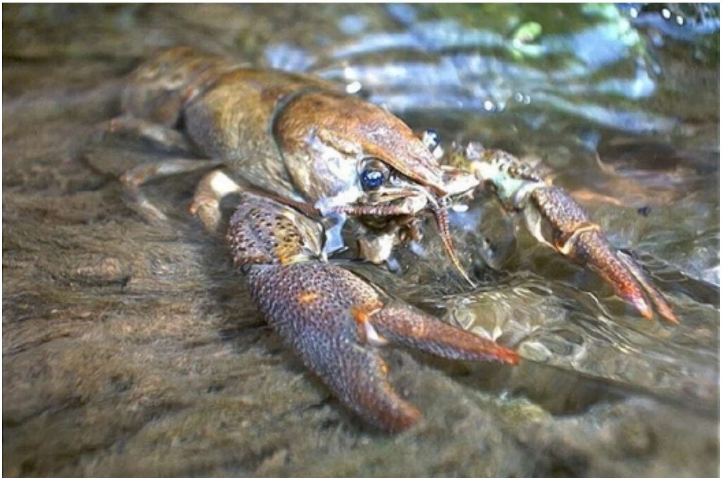
Cranc autòcton.

En quant a les aus destaquen, sense cap dubte, les rapinyaires, com l'escassa i amenaçada àguila cuabarrada, l'àguila marcenca, la calçada i l'astor. Entre les nocturnes, citar el gamarús, el mussol noi i el duc. La mastofauna està representada, entre d'altres, pel senglar, la guineu, la fagina, la geneta comuna i el toixó.