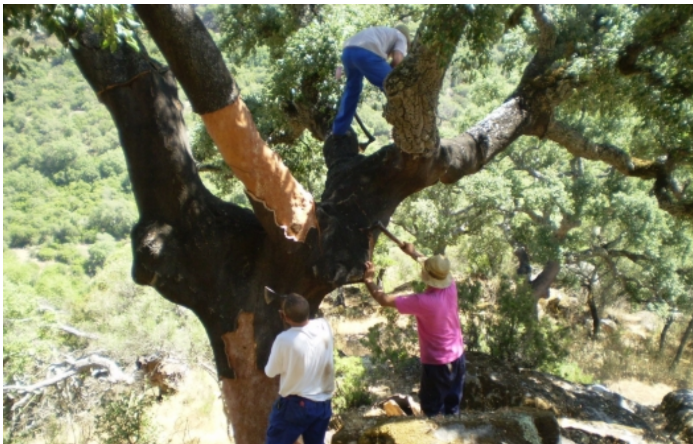
La pela del suro.