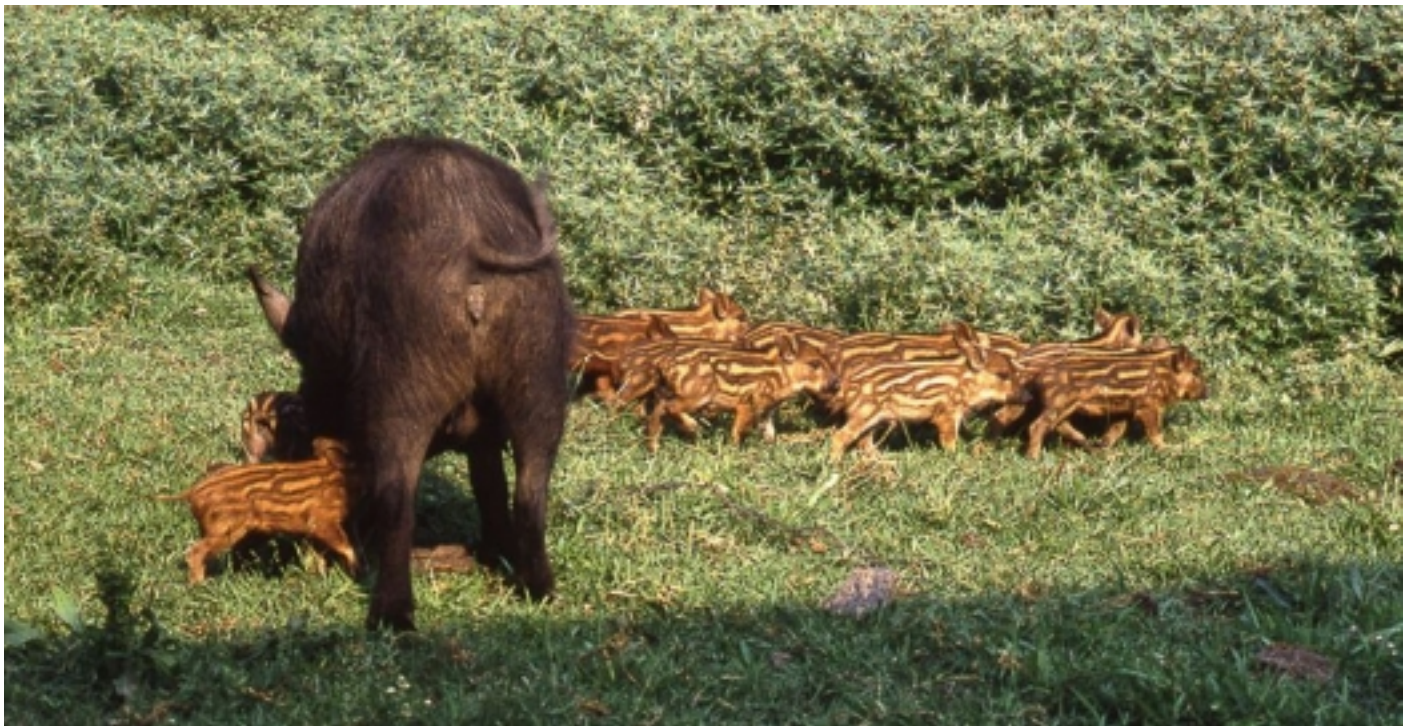
Senglar amb les seves cries.

Can Laporta C. Major 2 17700 La Jonquera, Girona T. 972 555 713