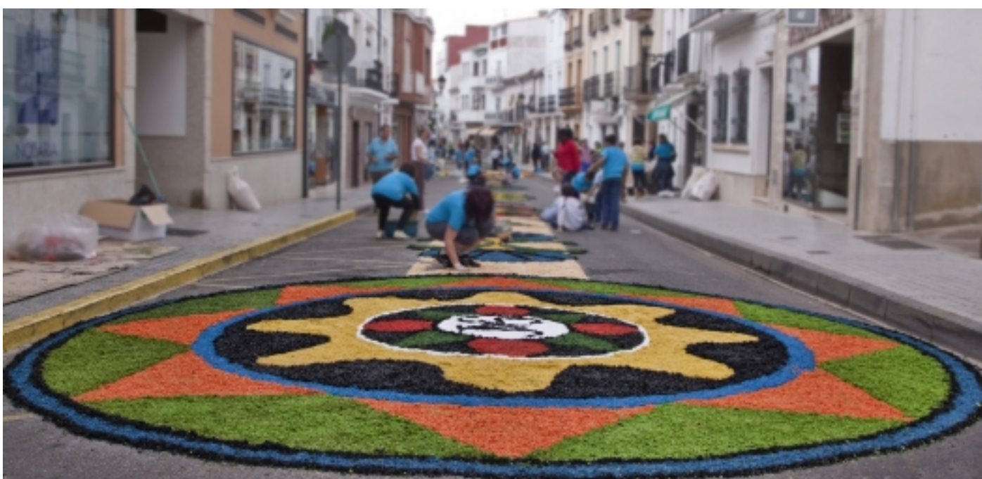
Corpus Christi.

► On menjar i dormir? http://turismociudaddelcorcho.es/empresas-turisticas/