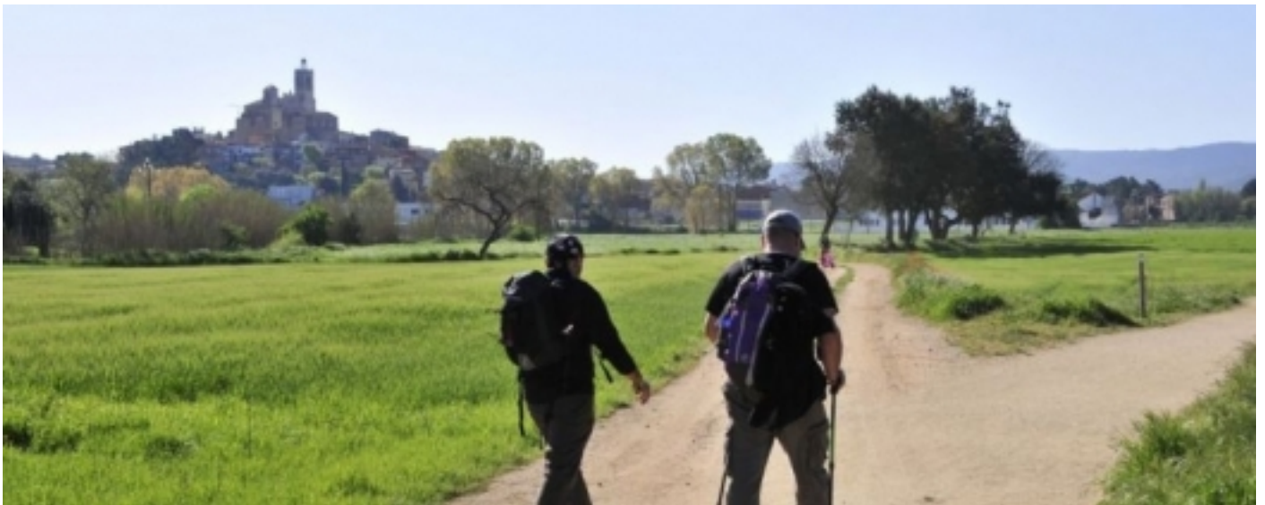
Via verda de Llagostera.

El senderisme, la bicicleta de muntanya o l'equitació , cobren un paper protagonista ja que aquests territoris disposen d'una extensa xarxa de camins i itineraris senyalitzats que permeten, a més de descobrir el paisatge característic de cada zona, endinsar-se al patrimoni històric, cultural i etnològic d'aquests espais.