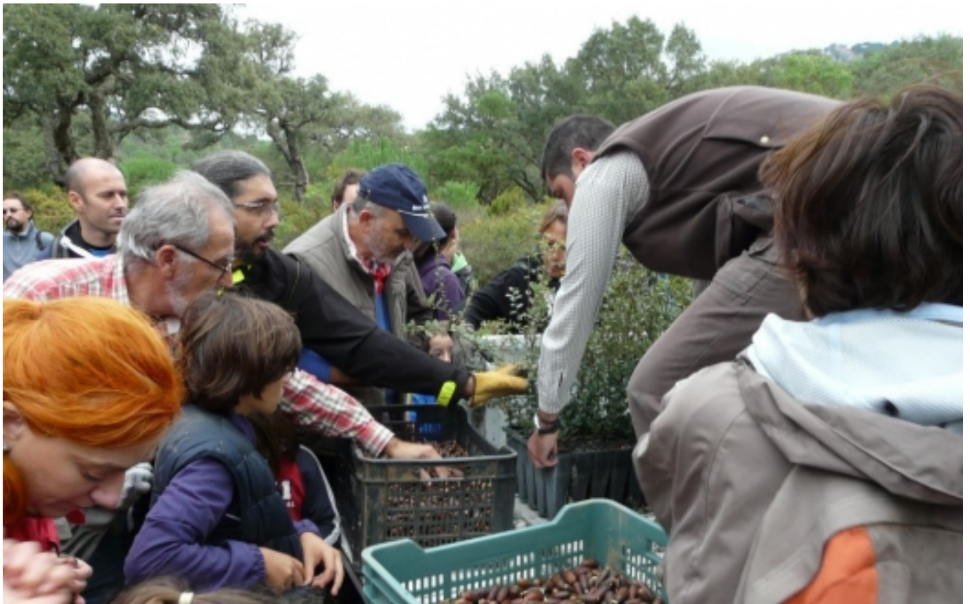
Jornada de replantació al Parc Natural de Los Alcornocales.

Per poder oferir-los-hi informació detallada d'aquestes activitats, la pàgina web Descobreix els territoris surers - www.visitterritorisurers.cat inclou un apartat que sota el títol Experiències turístiques , va incorporant totes aquestes ofertes que, en definitiva, són un bon aparador de les formes de descobrir l'excepcionalitat i singularitat d'aquests paisatges.