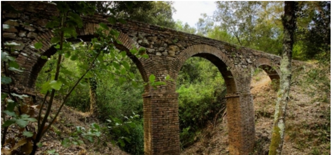
Aqüeducte Gran de Can Vilallonga (Consorci de Les Gavarres).

A més, ressalten també elements encara més antics com l'església parroquial, Can Frigola i la Torre Selvatana.