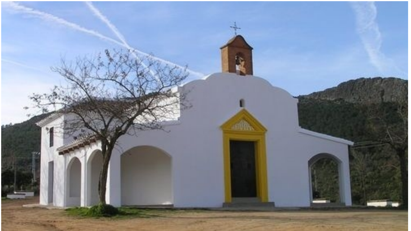
Ermita La Milagra.

Fonts: Informació extreta de www.navahermosa.es , www.diputoledo.es i Viquipèdia.