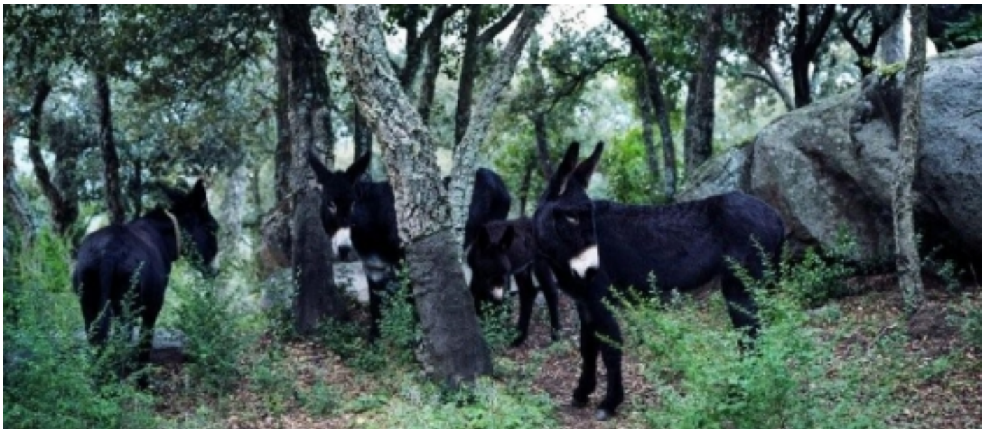
Les Gavarres, Romanyà de la Selva.

Fonts: Informació facilitada per ACER. Associació per a la Conservació de l'Entorn i la Recerca; i extreta de www.gavarres.cat , www.visitemporda.com , www.baixemporda-costabrava.org , http://es.wikiloc.com , www.globusemporda.com , www.hipicaunicorn.com , www.pipistrellus.com , www.espaiastronomic.com , www.rutesdelviemporda.com i Viquipèdia.