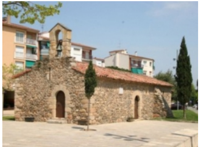
Sant Ponç.

Fonts: Informació extreta de www.santceloni.cat i Viquipèdia.