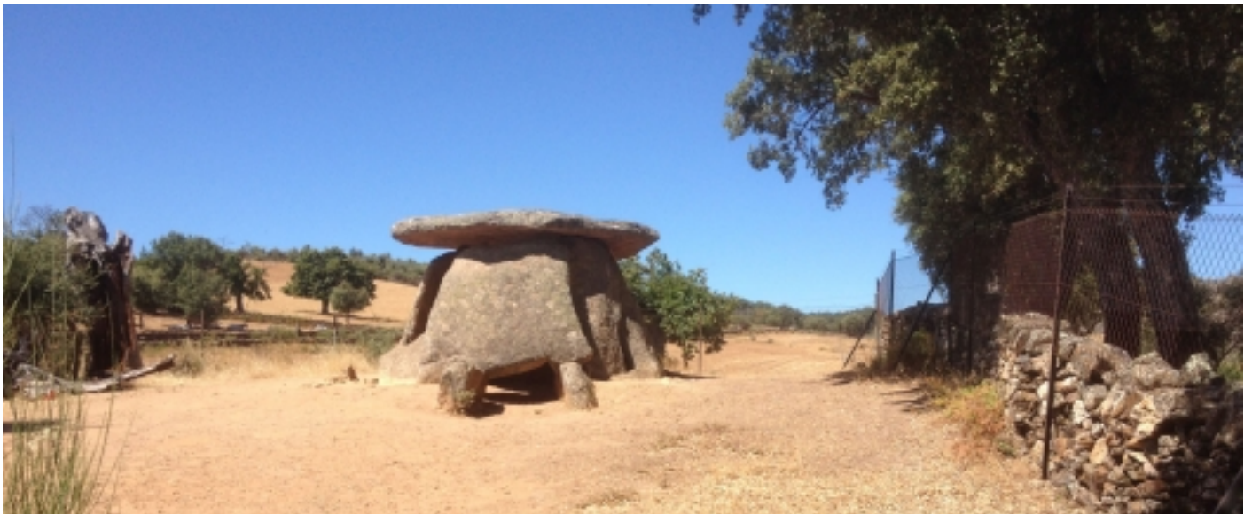
Dolmen El Mellizo, Valencia de Alcántara.

C. Cuatro Calles, 2 10980 Alcántara, Càceres T. 927 390 132 ci.tajointernacional@juntaextremadura.net