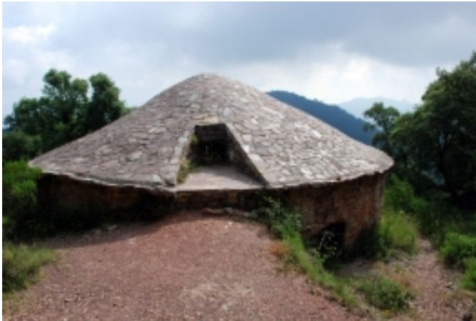
Nevera Castro.

En el Parc Natural de la Serra d'Espadà es localitza una considerable quantitat de recursos culturals, importants tant des del punt de vista historicoartístic com natural. Existeixen nombroses restes prehistòriques, de l'Edat de Bronze Valencià, iberes, romanes, medievals i, sobretot, moltes restes de castells que s'edificaven en època àrab.