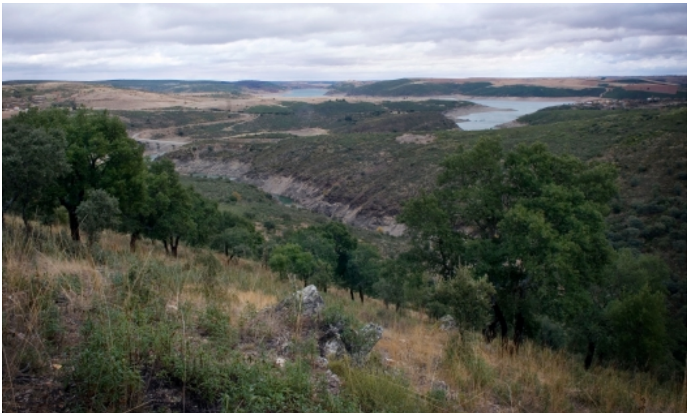
Muelas del Pan, Cerezal de Aliste.

Arrel d'aquesta singularitat, sorgeix la necessitat de potenciar el coneixement i divulgació d'aquest ecosistema i la seva importància; l'any 2003 comença la construcció del Centre d'Interpretació El Alcornocal .