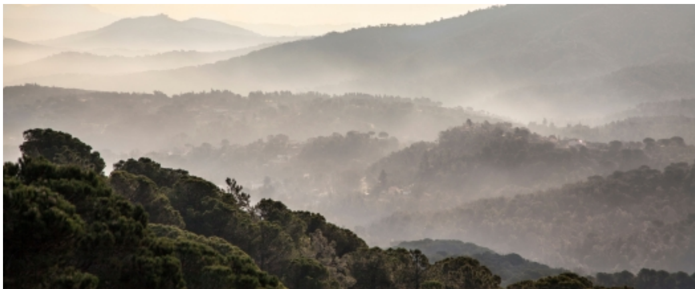
Vistes des de Roca-Rossa, Tordera.

Fonts: Informació extreta de www.tordera.cat i Viquipèdia.