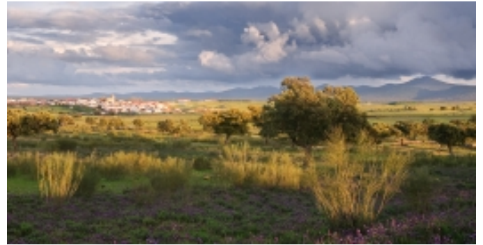
Sierra de San Pedro, Salorino.

D'altra banda, al Parc Natural Tajo Internacional existeixen multitud de rutes senyalitzades per poder practicar el senderisme, BTT, etc., sense oblidar les rutes fluvials del Barco Balcón del Tajo.