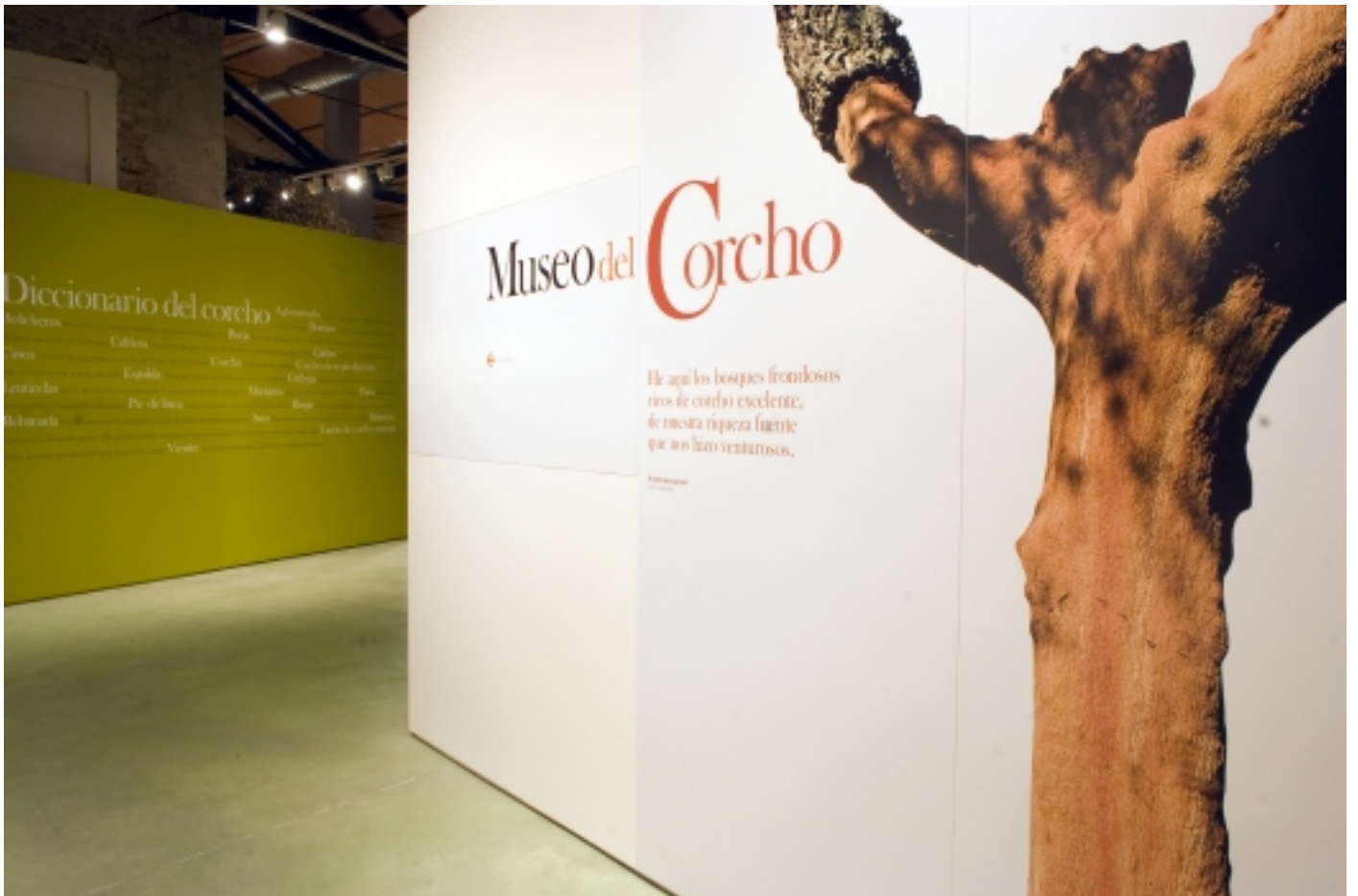
El Diccionari del Suro.

diccionari del suro, el qual mostra diverses paraules clau d'aquesta cultura. A continuació, ens descobreix l'alzina surera i el seu entorn, la sureda, que constitueix una veritable llar per espècies amenaçades. Per descriure què és el suro, el Museu compta amb una peça fonamental, una llesca del tronc d'una alzina surera a la que anomenen anells d'experiència , ja que permet observar clarament totes les seves parts, les quals l'arbre ha anat creant al llarg de la seva vida.