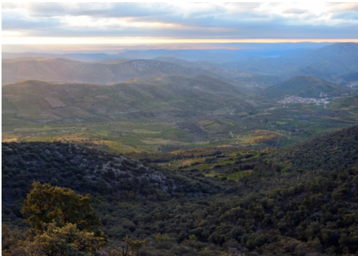
Panoràmica de la Sierra de la Virgen.

Fonts: Informació extreta de www.sestrica.es , www.viverdelasierra.com , www.turismodezaragoza.es , www.comarcadelaranda.com i Viquipèdia.