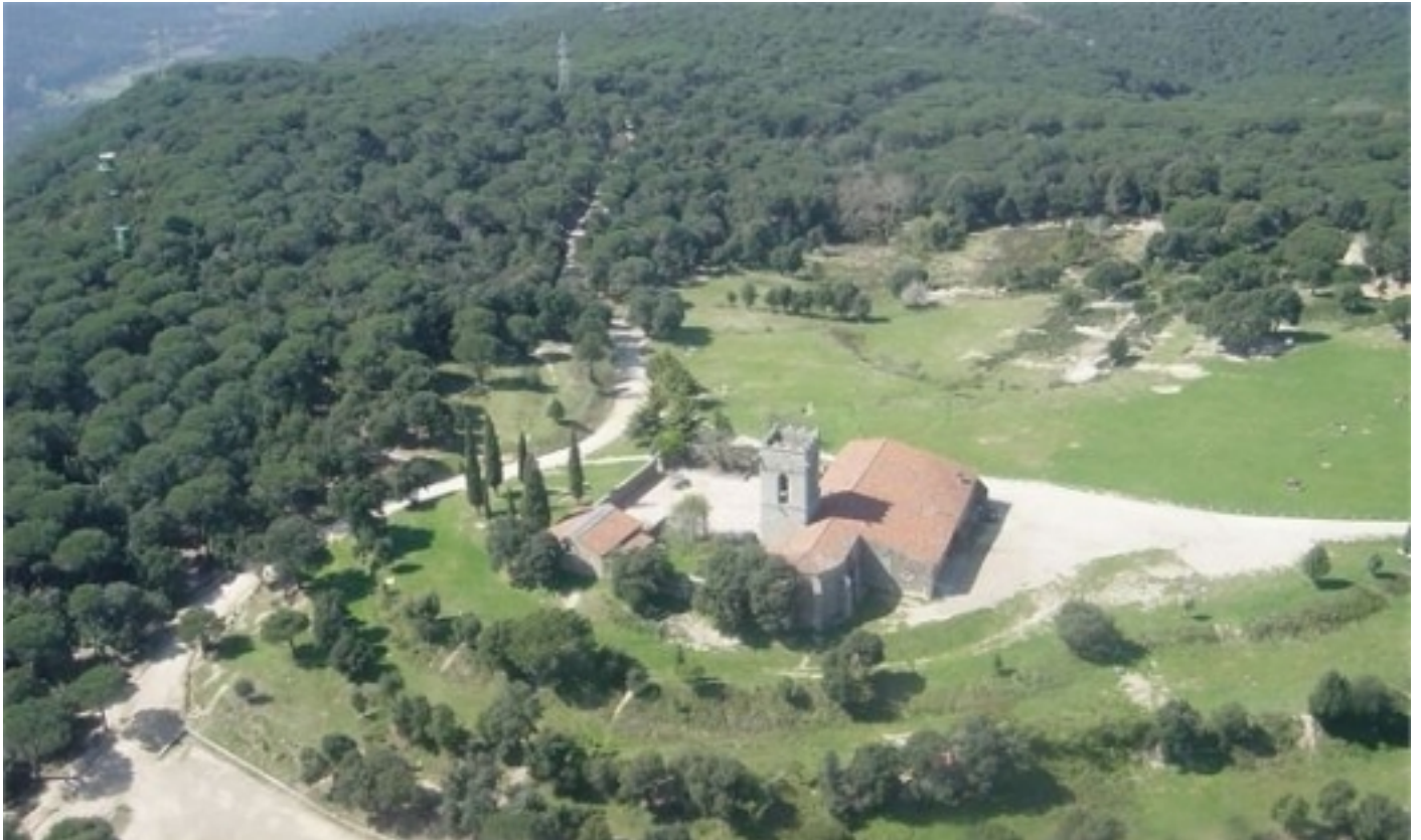
Santuari del Corredor.

Podran trobar altres centres i punts d'informació a: Hortsavinyà, Santuari del Corredor, Sant Cebrià de Vallalta, Arenys de Munt, Sant Iscle de Vallalta, Mercat de Tordera, Fogars de la Selva i l'Oficina de Turisme de Sant Celoni.