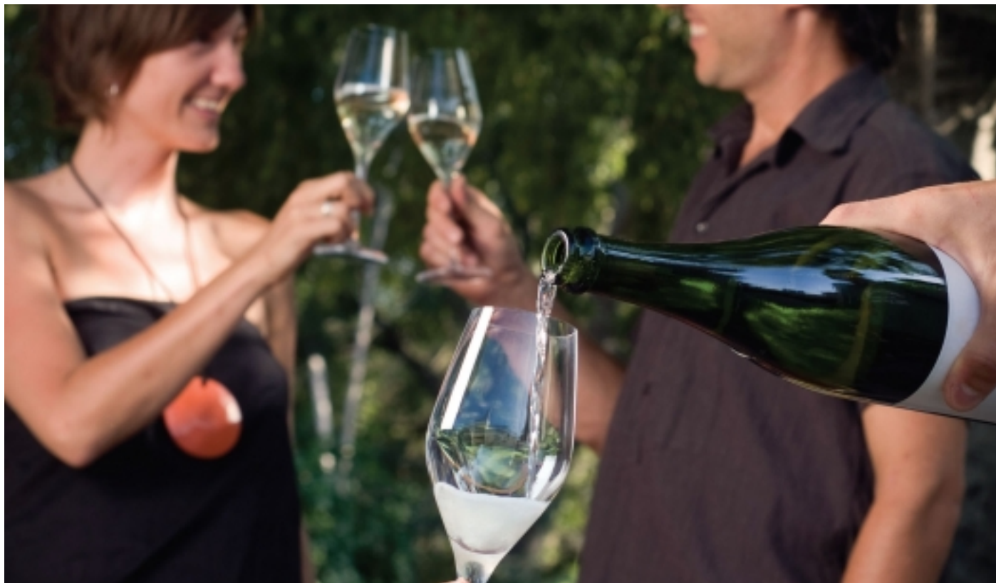
Cultura mediterrània.

Cal destacar que la zona de producció surera coincideix, en bona mesura, amb la de producció de vi i oli , cosa que permet combinar la visita d'alguns dels elements més emblemàtics de la cuina mediterrània.