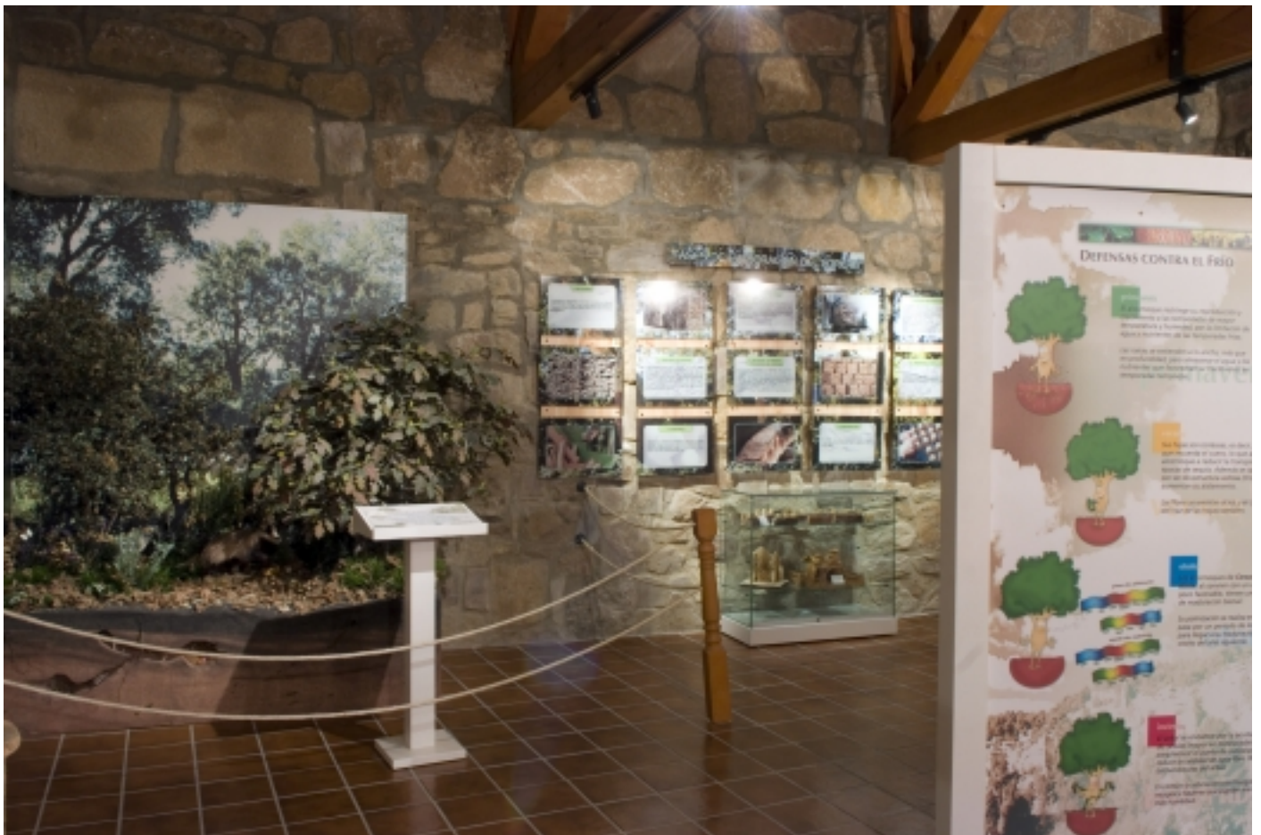
Plafons informatius del Centre d'Interpretació.

Font: Informació facilitada pel Centre d'Interpretació El Alcornocal.