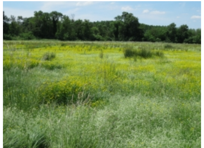
Prat de dall d'Esclat.

Fonts: Informació extreta de www.cassa.cat , www.turismegirones.cat i Viquipèdia.