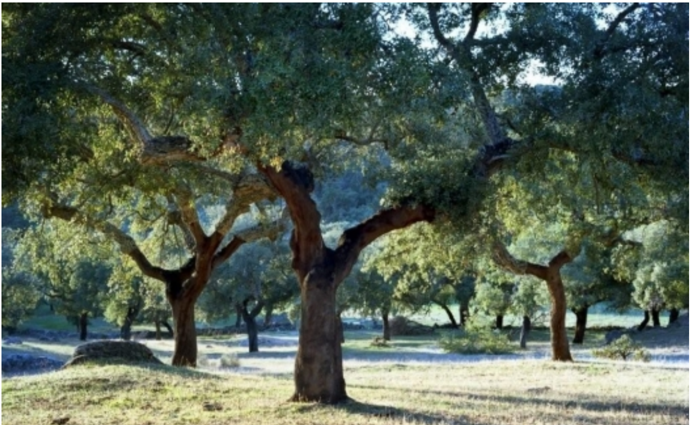
Sierra de San Pedro, San Vicente de Alcántara.

A la Sierra de San Pedro s'estableixen dos tipus de paisatge: la devesa i la serra. Alzinars i suredes constitueixen un dels ecosistemes més complexos i madurs del territori, presentant formacions intermèdies com les deveses, els boscos de matoll noble, el matoll oportunista, pasturatges, oliveres i altres cultius. A més, cal esmentar els boscos de ribera, formats per verns i freixes.