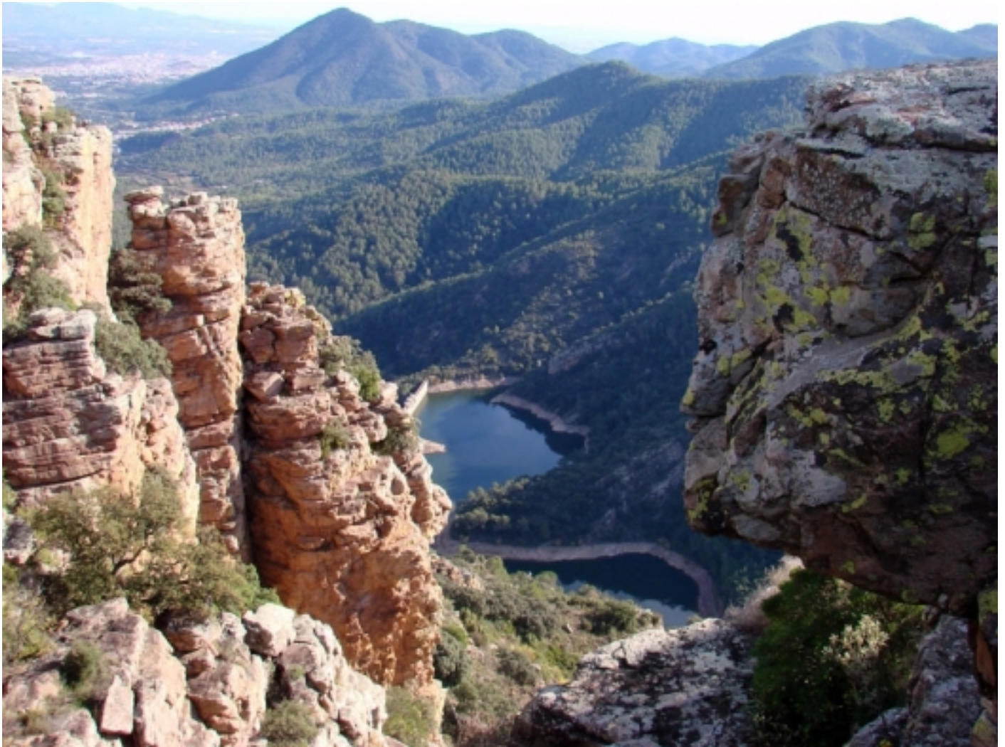
Parc Natural de la Serra d'Espadà.

Posseeix un clima mediterrani i els vents i les pluges són canalitzats pel relleu, que produeix un efecte barrera per la seva disposició. El Parc Natural fou declarat el 1998.