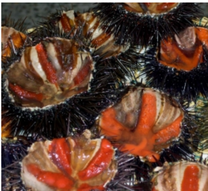
La Garoinada. Foto: Lluís Maimí