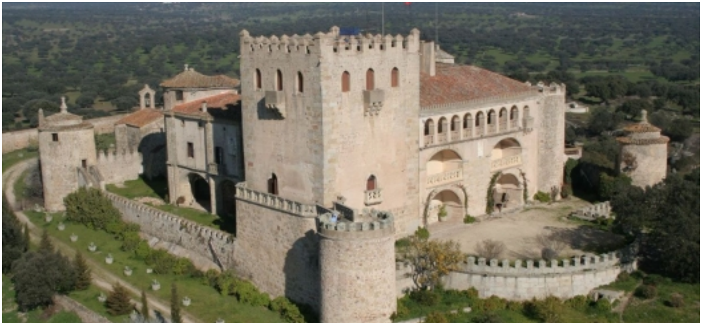
Castell de Piedrabuena, San Vicente de Alcántara.

Plaza de España s/n 06510 Alburquerque, Badajoz T. 924 401 201