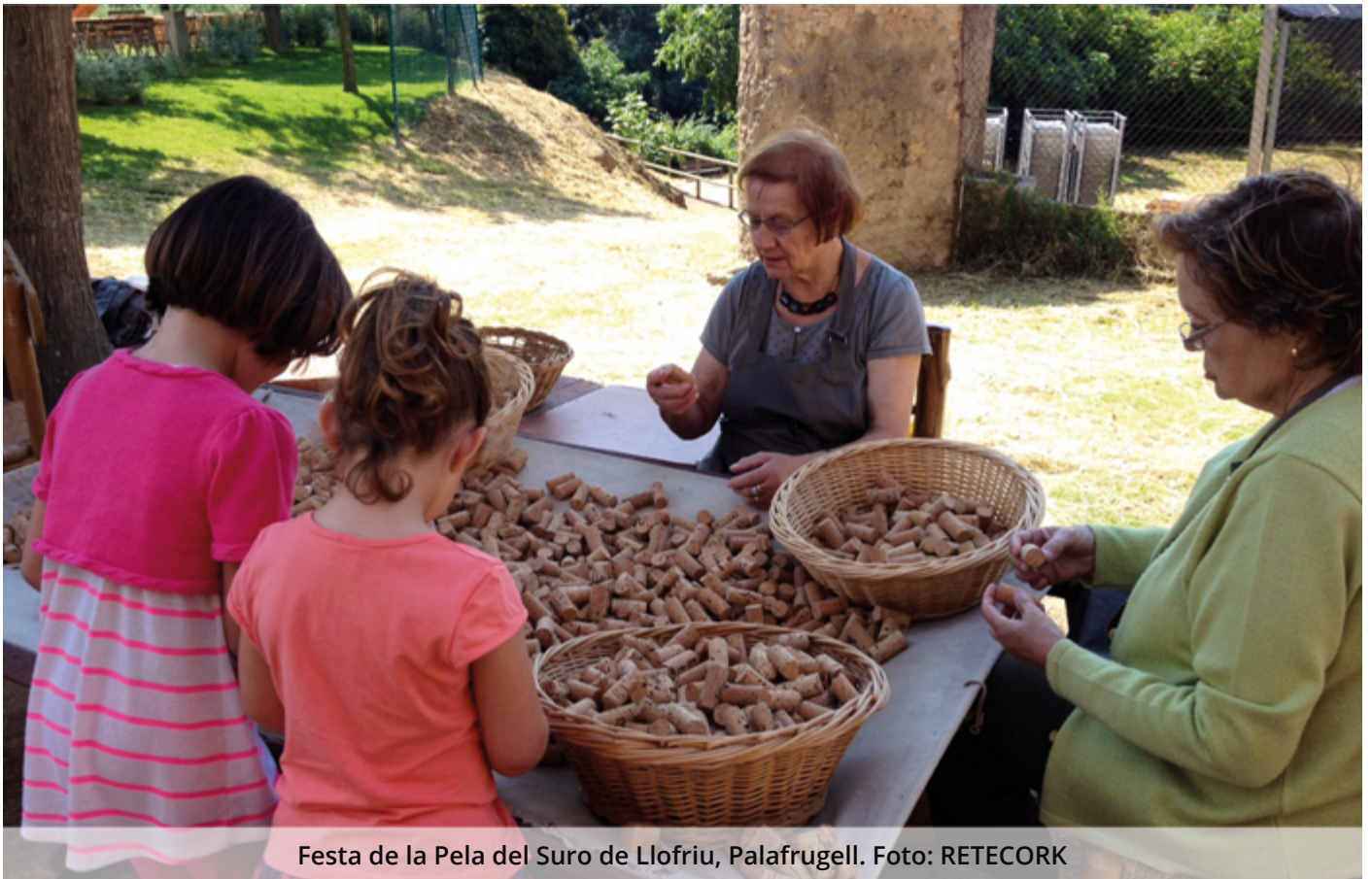
Festa de la Pela del Suro de Llofriú, Palafrugell.