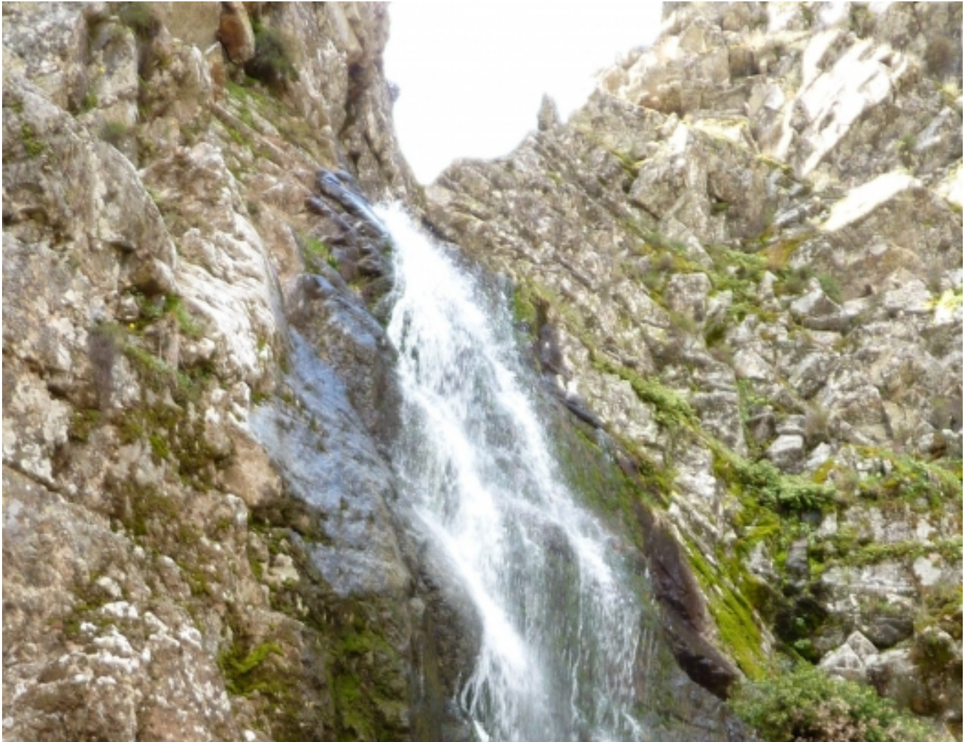
Hoz de Carboneros.

Navahermosa divideix el seu paisatge entre les serres del sud i els terrenys plans del nord. Al segle XIX, gairebé la meitat de la població es dedicava a la fabricació del carbó i la producció de l'oli, activitat que posteriorment comptarà amb trulls industrials i la Denominació d'Origen Montes de Toledo . Entrant ja al segle XX, prenen importància les fàbriques sureres.