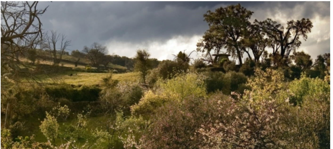
Els dòlmens, València de Alcántara.

No obstant, el més destacat de l'entorn són els seus espais naturals, destacant el Parc Natural del Tajo Internacional i la Sierra de San Pedro .