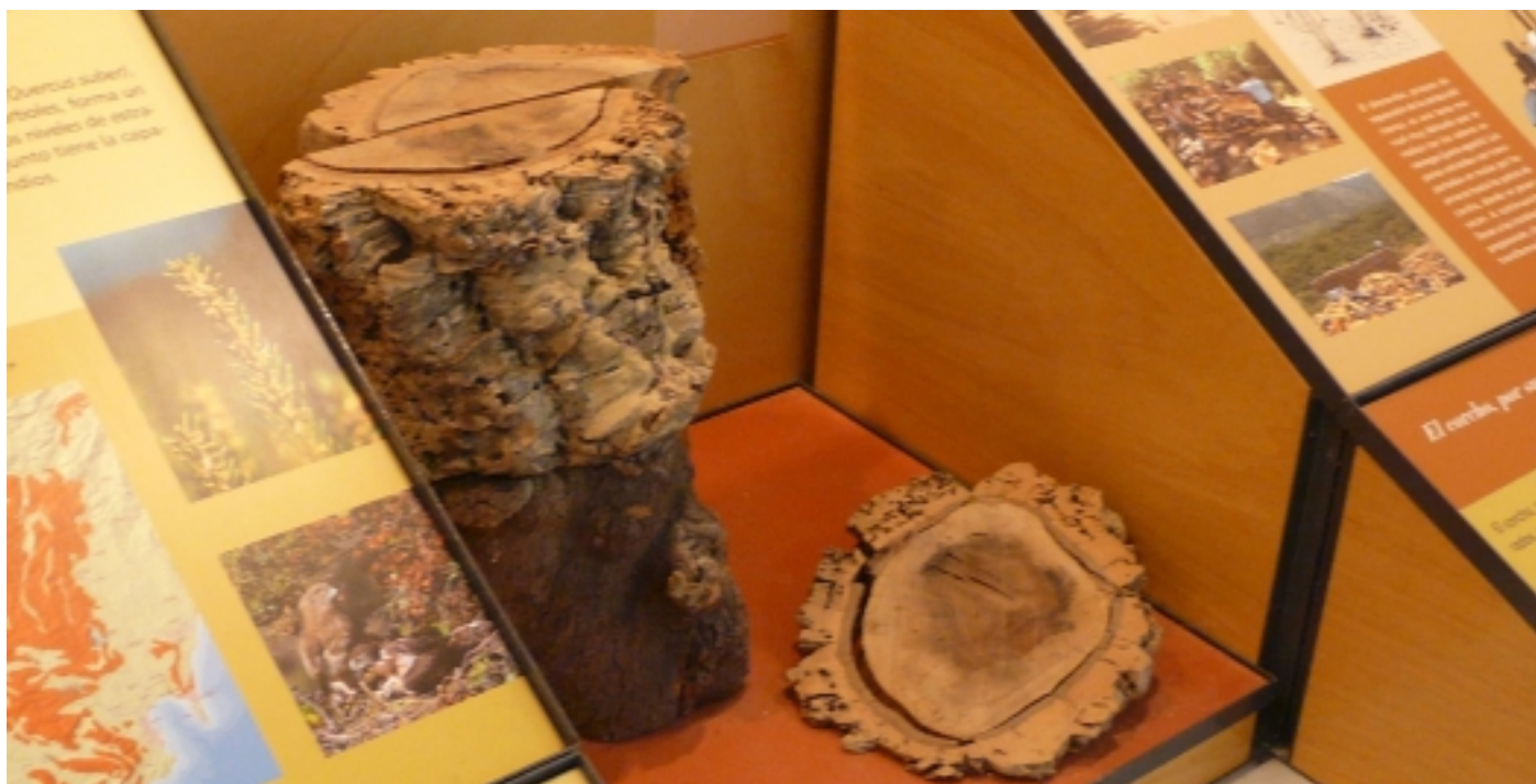
L'escorça de l'alzina surera.

Centre de Visitants El Aljibe Parc Natural de Los Alcornocales Ctra. A-2228 Alcalá de los Gazules-Benalup Casas Viejas, km 1 11180 Alcalá de los Gazules, Cadis T. 956 418 614