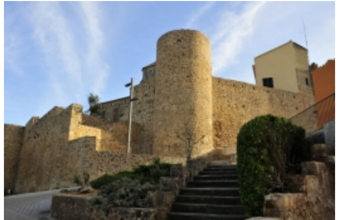
La muralla de Llagostera.

D'alta banda, en tot el seu entorn natural, trobareu una xarxa de senders de diferent tipus i recorregut i un centre de BTT , molt ben senyalitzats.