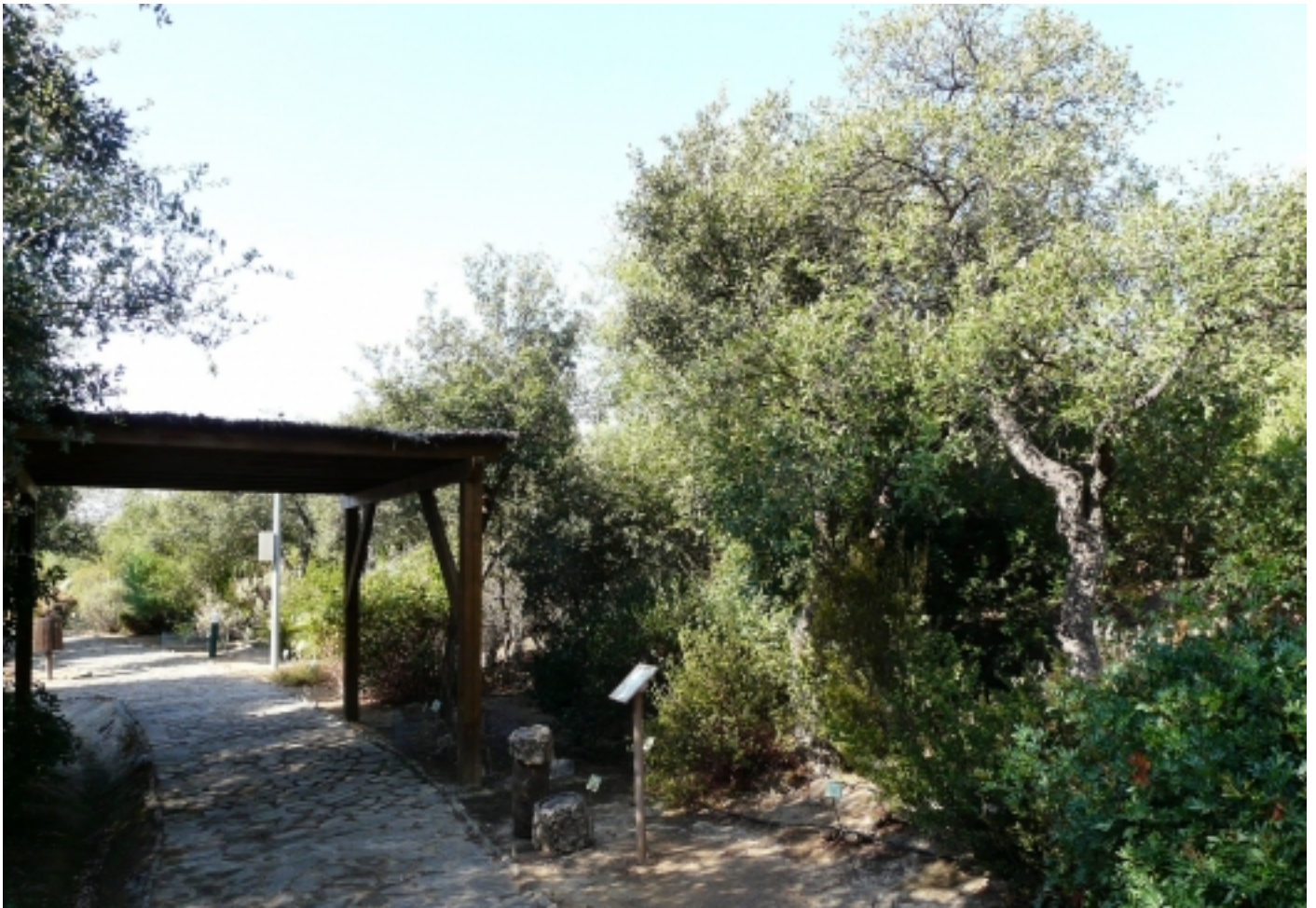
Jardí Botànic El Aljibe.

Per completar els continguts, els guies del Centre ofereixen la possibilitat de visitar la Suberoteca d'Andalusia , situada a escassos 150 metres, així com una representació de la sureda al també contigu jardí botànic.