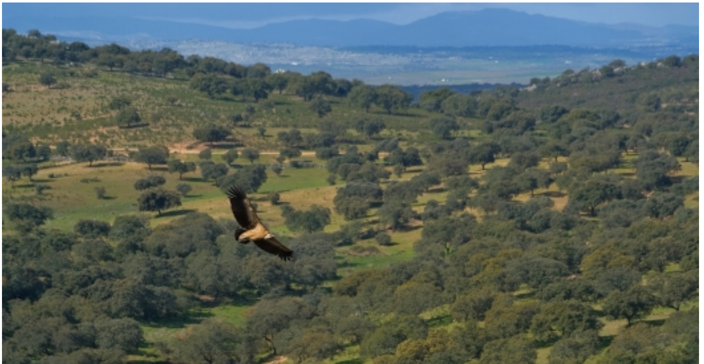
Sierra de San Pedro.

En el cas de la sureda, com millor sigui gestionada, més elevada serà la seva taxa de fixació d'hidrogen de carboni. Per generar la capa de suro, l'alzina surera ha d'absorbir una quantitat de CO 2 addicional. Així, segons l'Institut del Suro, la Fusta i el Carbó Vegetal d'Extremadura, una sureda ben gestionada reté 6.200 kg de CO 2 per hectàrea i any, enfront als 3.600 kg d'una sureda en la qual no es realitza cap tipus de tasca, o els 2.200 kg que, de mitjana, fixen els boscos reforestats a Espanya.