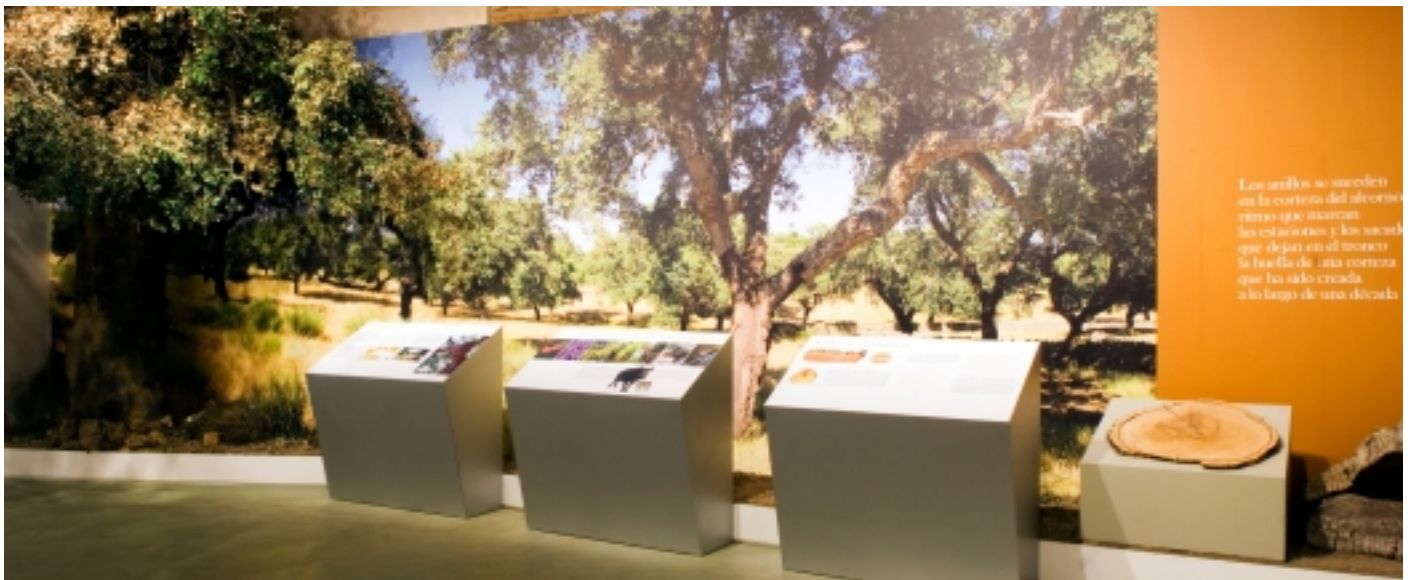
L'alzina surera i el seu entorn.

Av. Juan Carlos I, 33 06500 San Vicente de Alcántara, Badajoz T. 924 410 945 laurabrixedo@hotmail.com