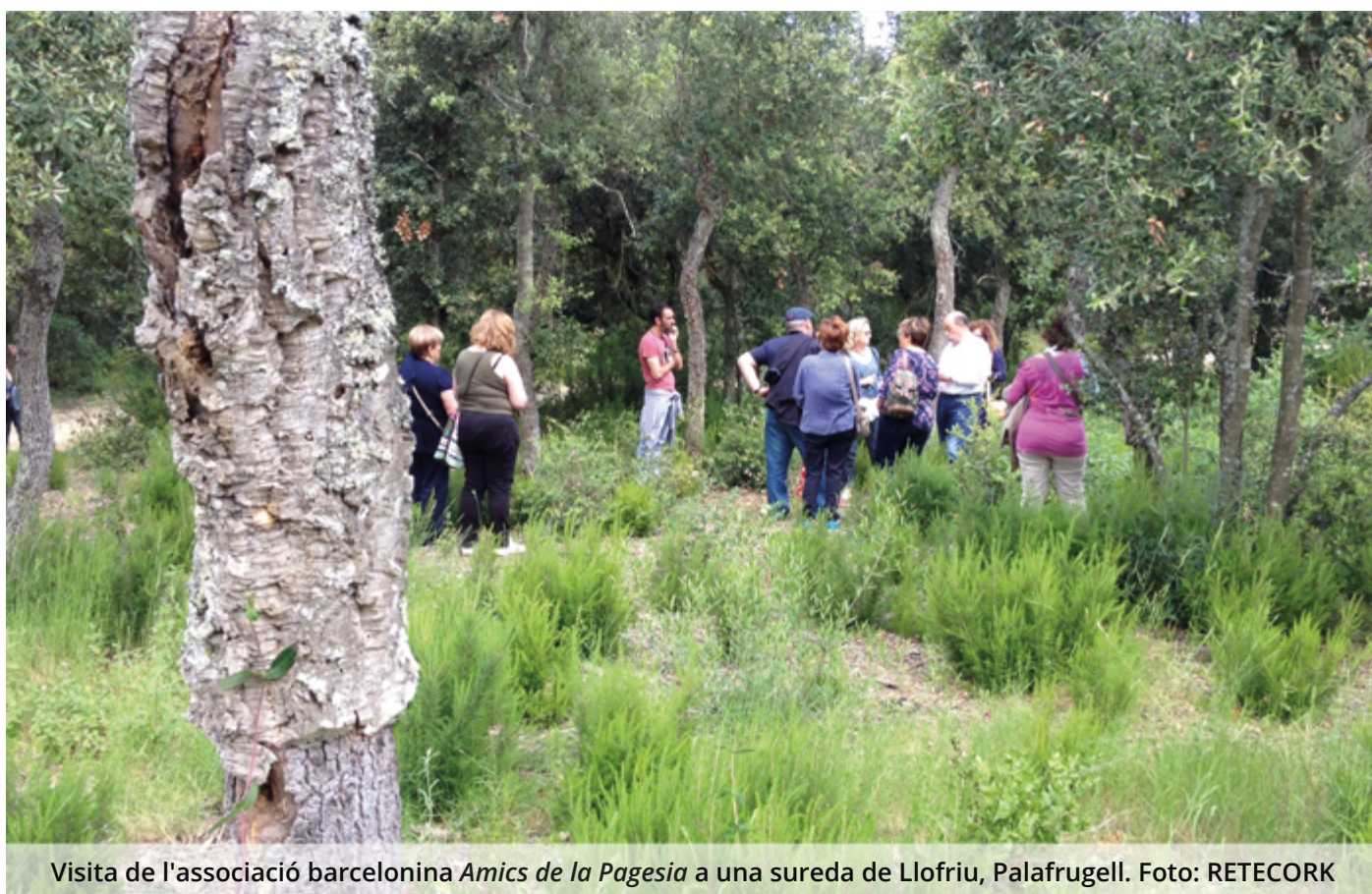
Visita de l'associació barcelonina Amics de la Pagesia a una sureda de Llofriu, Palafrugell.