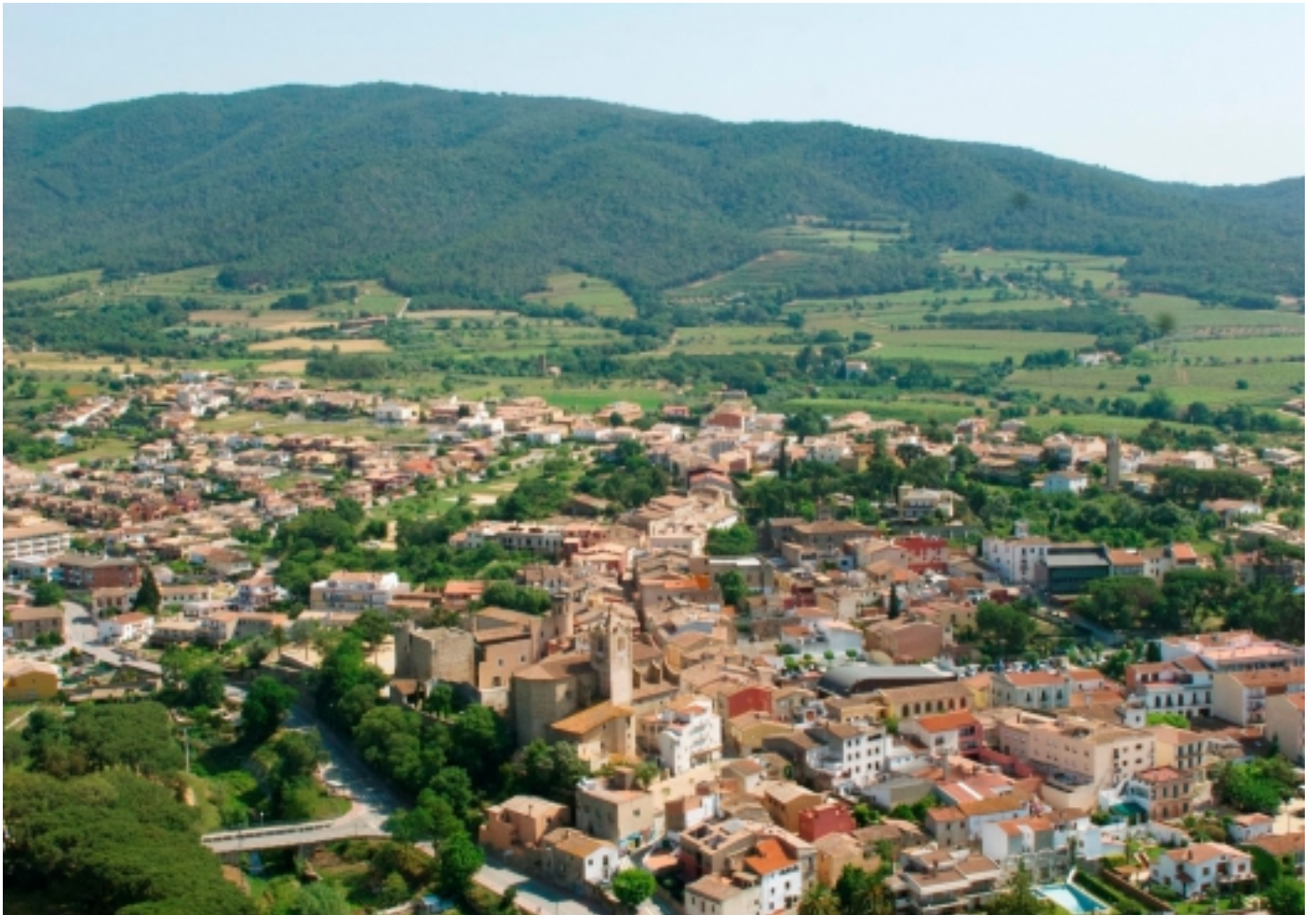
Vista aèria de Calonge amb Les Gavarres al fons.

Fonts: Informació extreta de www.calonge.cat , www.calonge-santantoni.com i Viquipèdia.