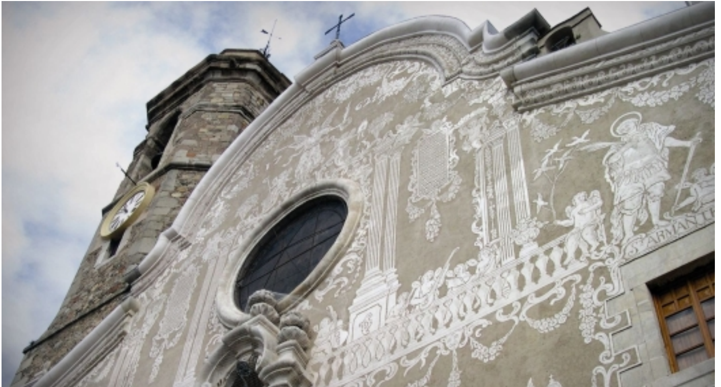
Església de Sant Celoni.

El relleu a aquesta vitalitat ha estat pres per la considerable implantació industrial, erigida els últims anys com el principal motor de l'economia local.