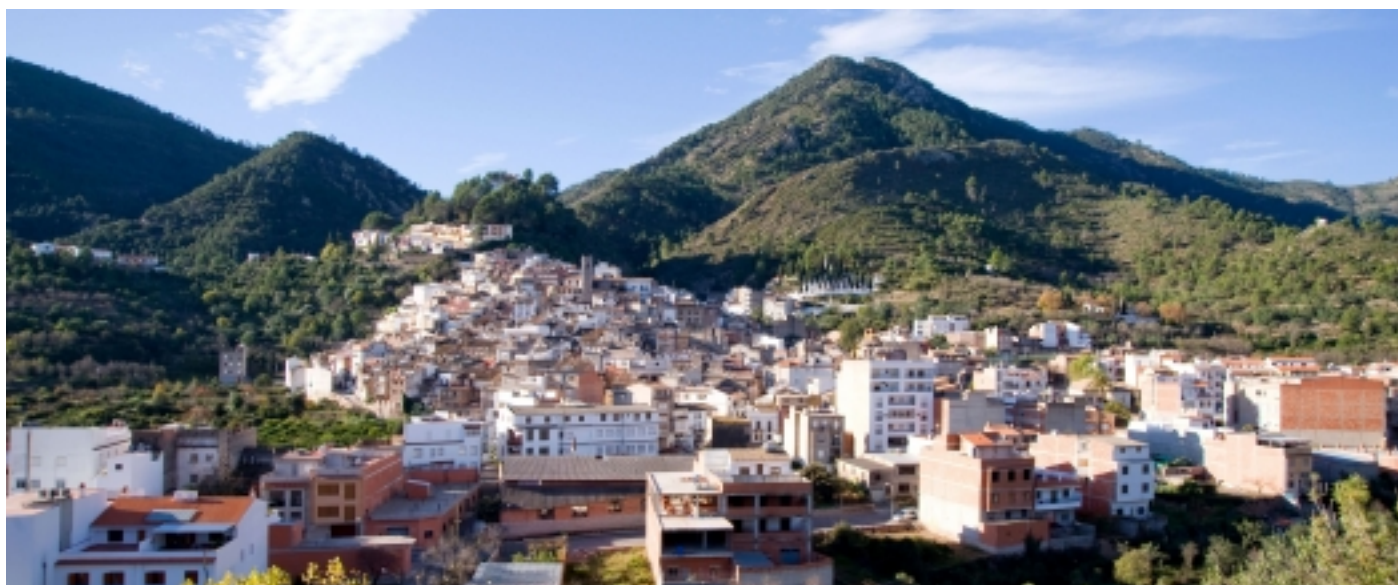
Vista d'Eslda.

Fonts: Informació extreta de www.eslida.es , http://parquesnaturales.gva.es i Viquipèdia.