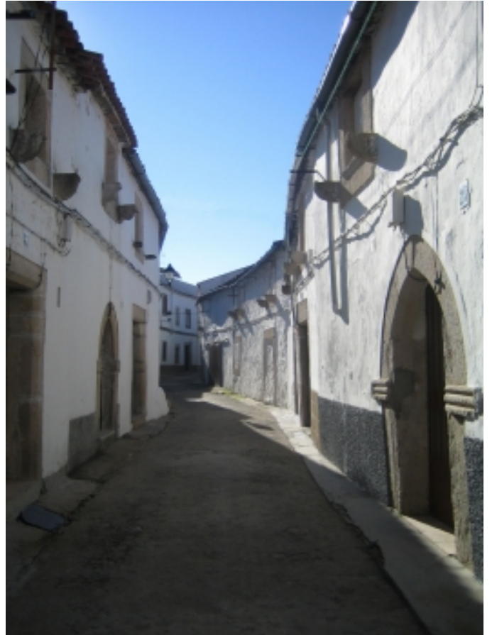
Barri gòtic, Valencia de Alcántara.

D'altres èpoques trobarem varis monuments històrics nacionals (com l'Església de Rocamador de Valencia de Alcántara), edificis i conjunts històrics (com el Barri Gòtic de Valencia de Alcántara) i un nombrós conjunt d'esglésies i ermites de curiosa arquitectura popular.