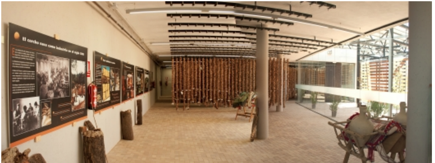
La Suberoteca.

El mostrari conté, avui dia, suro de 1.294 zones d'extracció de tota Andalusia, i la seva consulta està disponible tant per industrials com per productors, contribuint amb això al desenvolupament socioeconòmic del medi rural andalús.