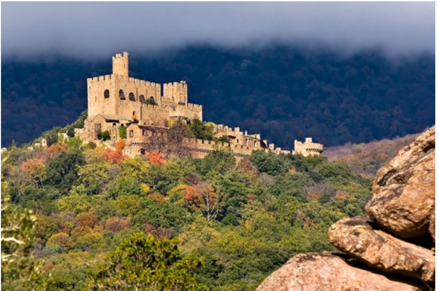
Castell de Requesens.