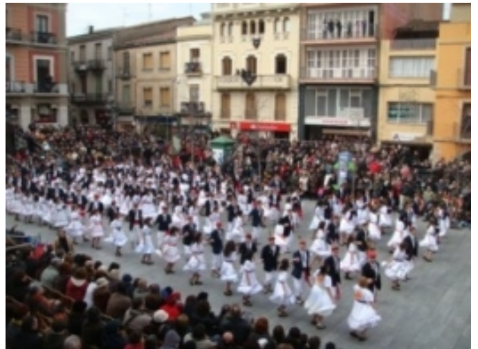
Ball de gitanes.

Tastets d'estiu, la Tardor gastronòmica i la Mostra de Torrons Artesans. Destaca un dolç propi, els celonins, fets amb base de pasta de galeta, diferents xocolates i ametlla. Representen les dues muntanyes que envolten Sant Celoni: el Montseny, amb xocolata blanca, i el Montnegre, amb xocolata negra.