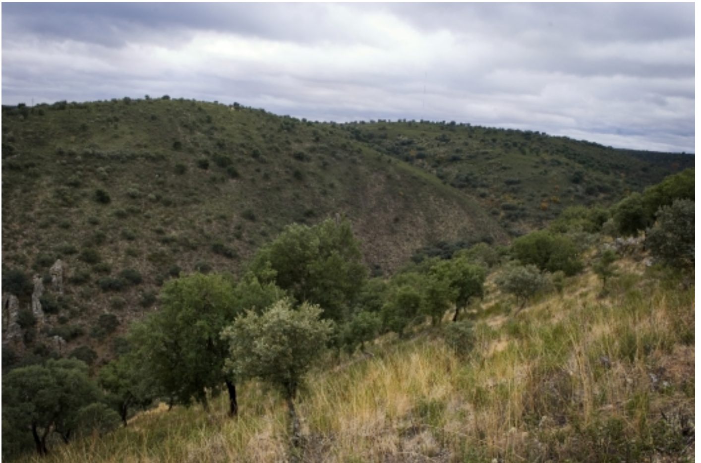
Muelas del Pan, Cerezal de Aliste.

Muelas del Pan es troba a tan sols 22 km de la ciutat de Zamora. Aquesta ciutat, amb els seus 23 temples en el terme municipal i 14 esglésies al casc antic, s'ha convertit en la ciutat amb major nombre i qualitat de temples romànics d'Europa. Tot això l'ha fet mereixedora de la denominació Perla del Romànic en el món de l'art.