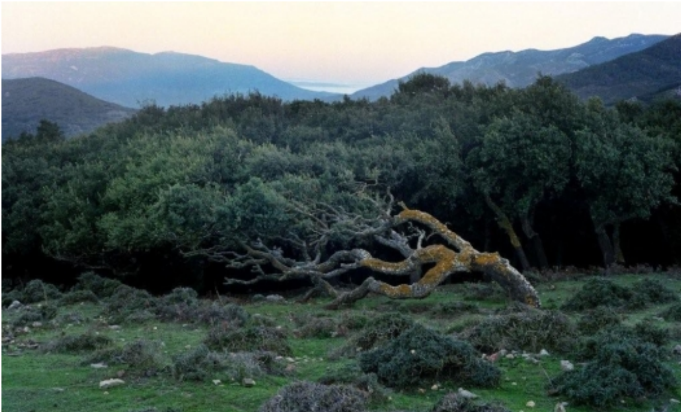
Parc Natural del Estrecho.

A continuació els oferim unes pinzellades del que poden descobrir a través dels espais naturals més vinculats als municipis surers, però no dubtin en consultar la nostra pàgina web ( www.visitteritorissurers.cat ) per conèixer-los en profunditat i les possibilitats que posen al nostre abast.