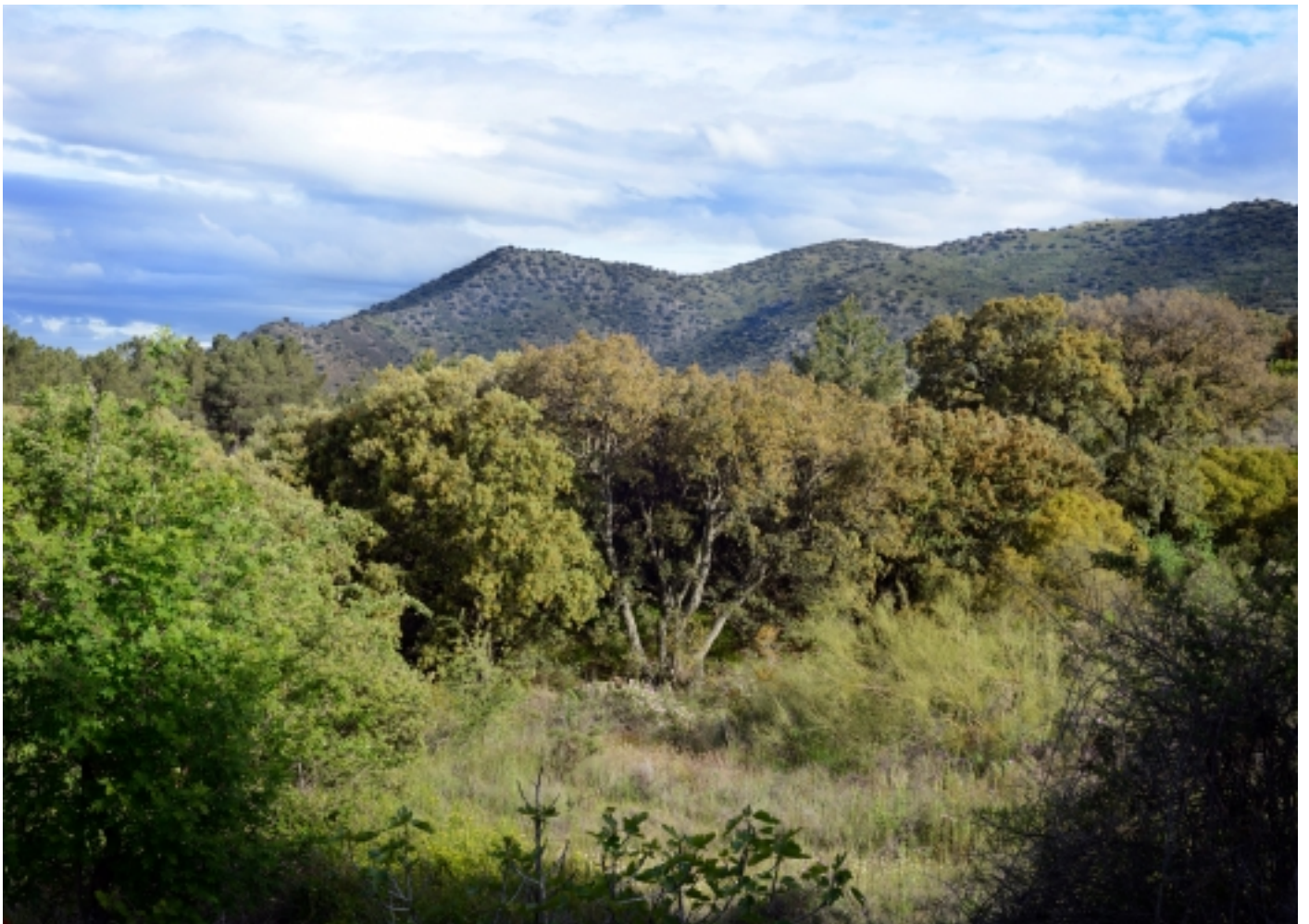
Sureda de Sestrica.

Actualment, les condicions climàtiques de Sestrica i Viver de la Sierra afavoreixen que existeixi una producció de gran qualitat com l'olivera, la cirera o l'ametlla, la majoria cultivats sense reg. Per això, podem dir que el municipi es situa en un enclavament únic pel descans i practicar esports i activitats d'oci a l'aire lliure ; tot sense oblidar que es troba a poc menys d'una hora de la capital de la comunitat autònoma, Saragossa.