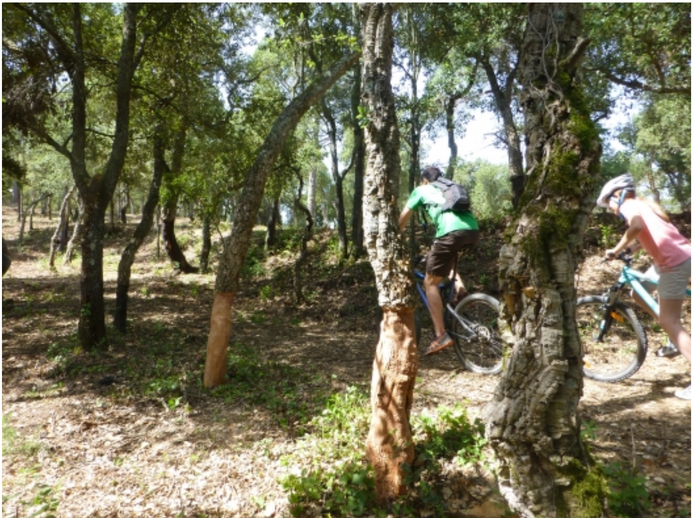
Bicicleta de muntanya per camins i itineraris senyalitzats.

Els amants de l'ecoturisme i la natura, els més aventurers, els gourmets i selectes, els històrics i tradicionals, les famílies i nens, els grans... trobaran en ells una multitud d'ofertes i productes per gaudir d'un ecosistema únic i singular del Mediterrani Occidental.