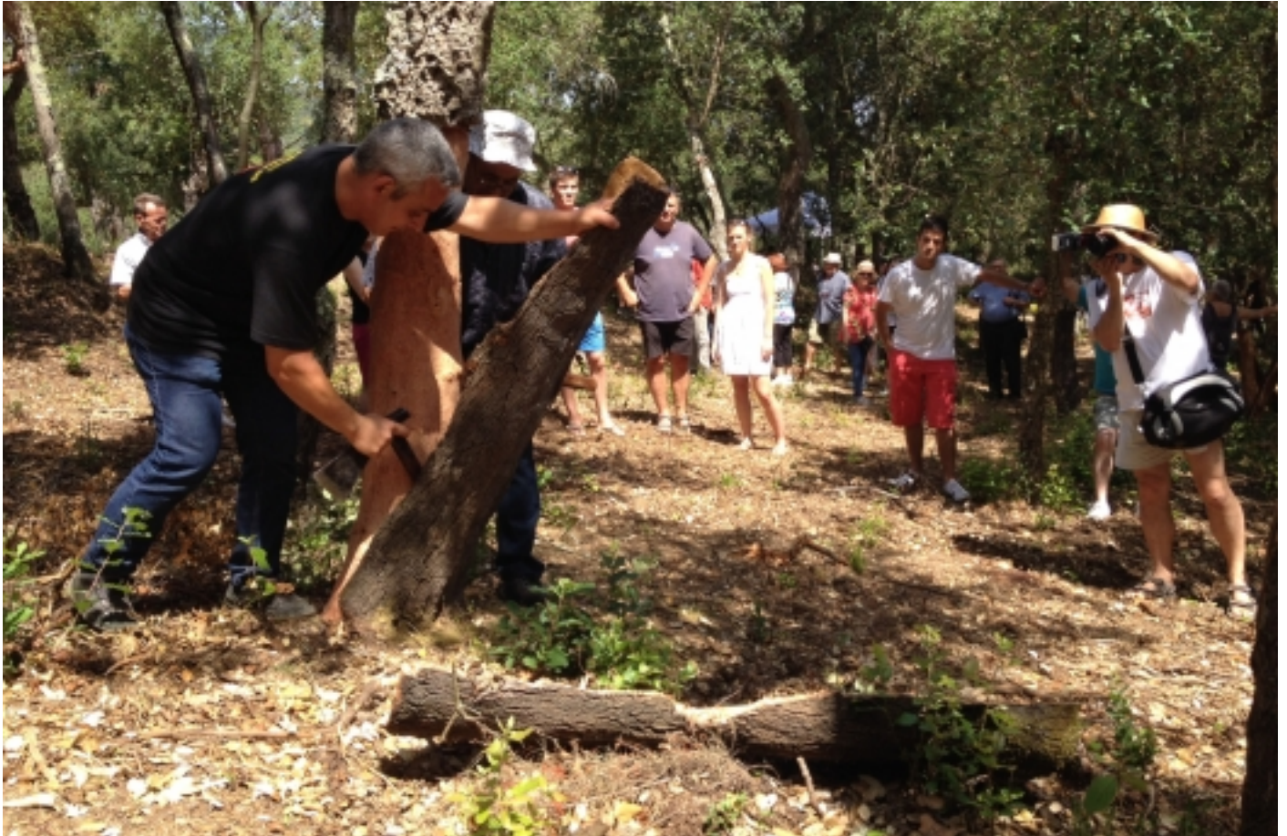
Visita a la pela del suro, Llofriu.