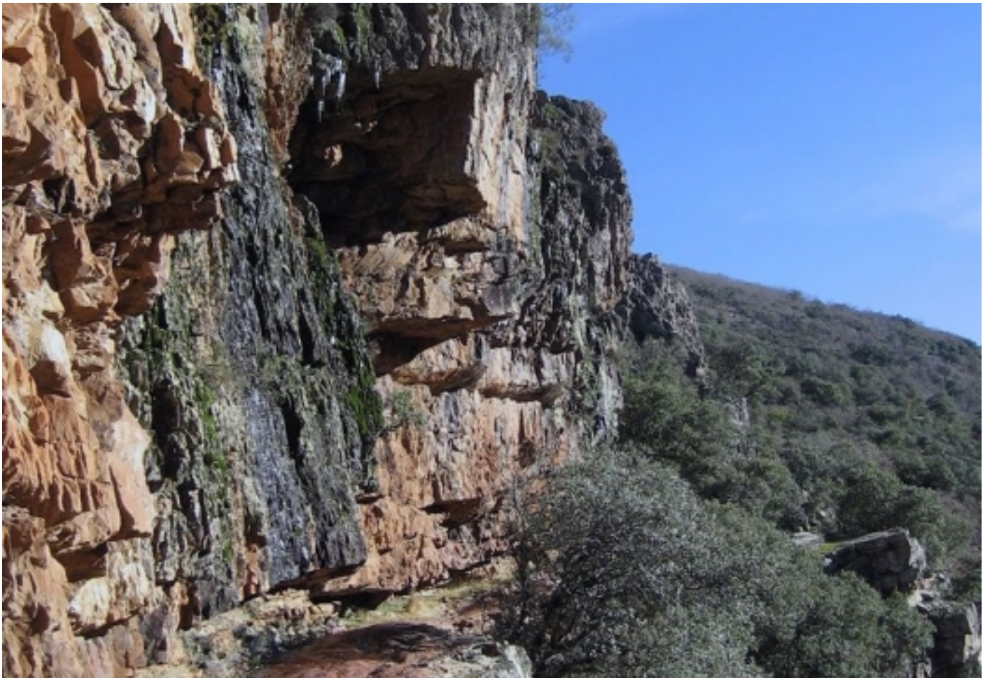
Cornises del doll.

Poden trobar un Centre de Visitants a Alcoba de los Montes, Museu Etnogràfic i d'Informació a Alcoba i Horcajo i punts d'informació a Navas de Estena i a Los Navalucillos.