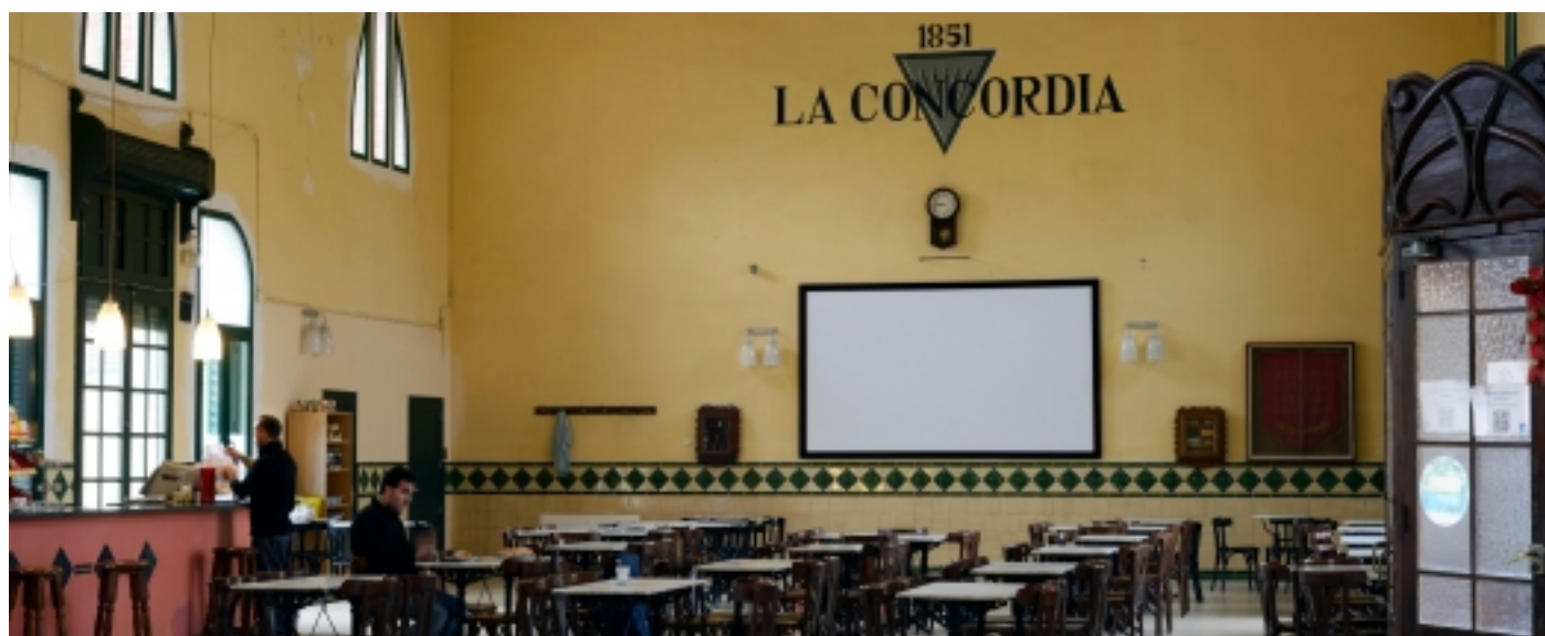
Cafè La Concòrdia, Agullana.

Fonts: Informació extreta de www.agullana.cat , www.salines-bassegoda.org i Viquipèdia .