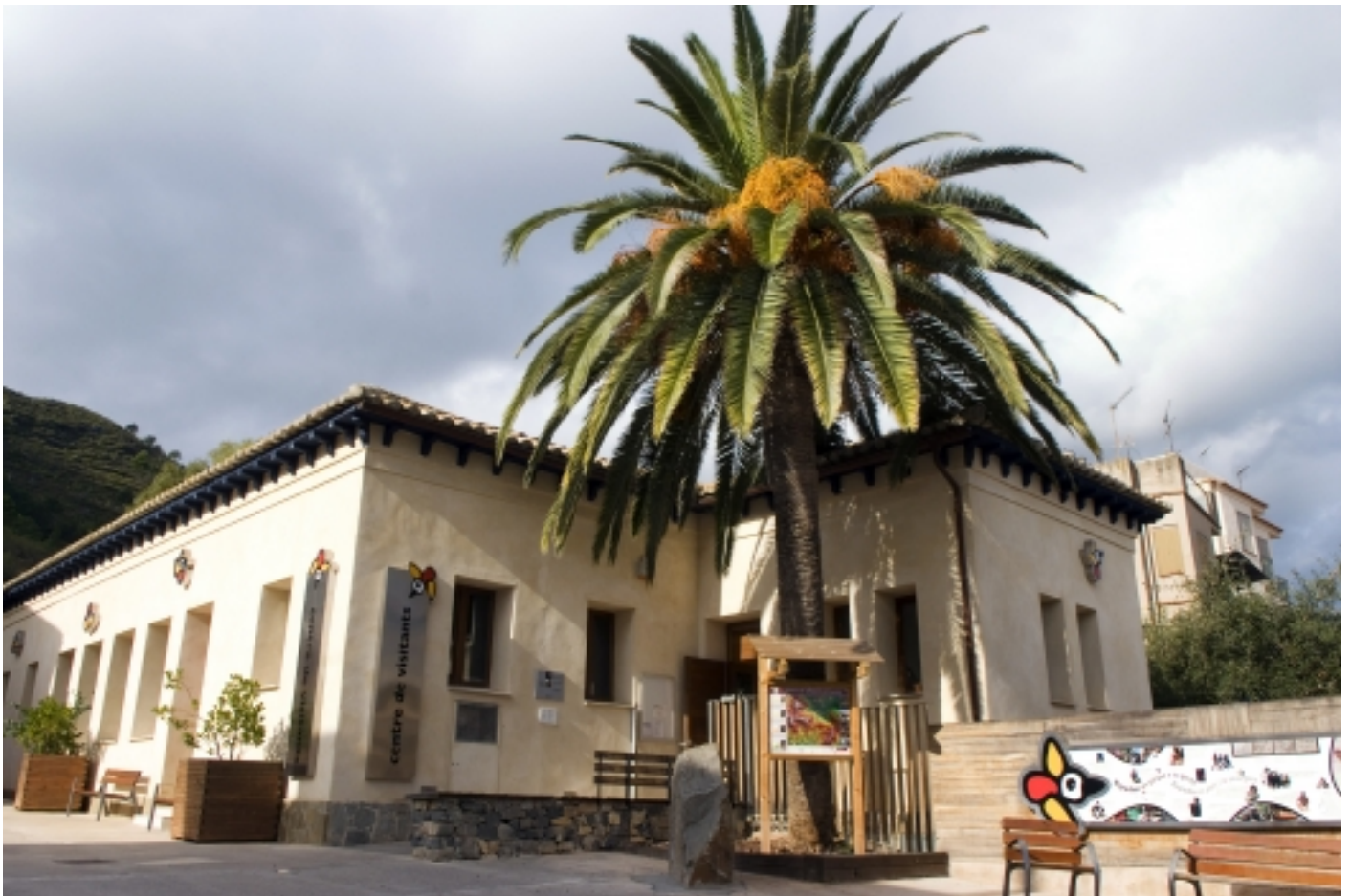
Centre de Visitants del Parc Natural de la Serra d'Espadà, Eslida.

El Centre s'ubica a Eslida, localitat inclosa a l'espai protegit. Es tracta de l'antiga escola del municipi, que fou restaurada i condicionada pel seu ús com a centre de visitants.