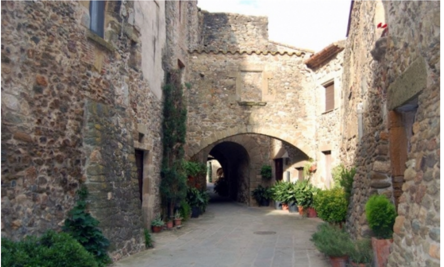
Les Gavarres, Peratallada.