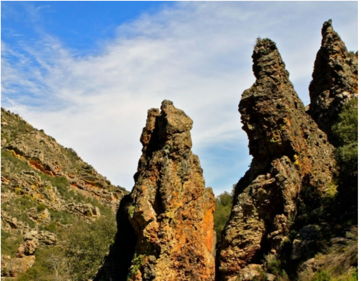
Torres d'Estena.

Les serres d'aquest Parc estan molt erosionades i presenten un aspecte ondulat. L'altitud oscil·la entre els 620 metres al nivell basal, fins els 1.500 metres als cims del Rocigalgo. Ocupa part de les províncies de Ciutat Real i Toledo, i és Zona d'Especial Protecció per les Aus (ZEPA) i Lloc d'Importància Comunitària (LIC).