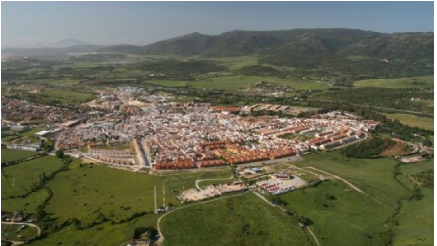
Panoràmica de Los Barrios.

Los Barrios és un dels municipis que major superfície aporta al Parc Natural de Los Alcornocales, declarat com a tal pel Parlament d'Andalusia el 1989.