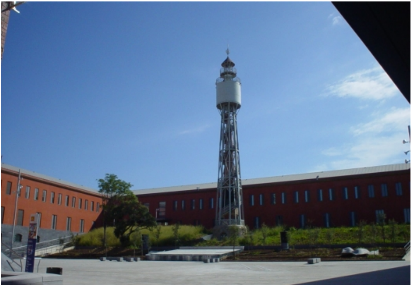
Antic dipòsit d'aigua de la fàbrica surera de Can Mario, Palafrugell.

Us convidem a que valoreu el seu potencial. Ubicats al medi rural, constitueixen un element clau a les polítiques de desenvolupament sostenible.