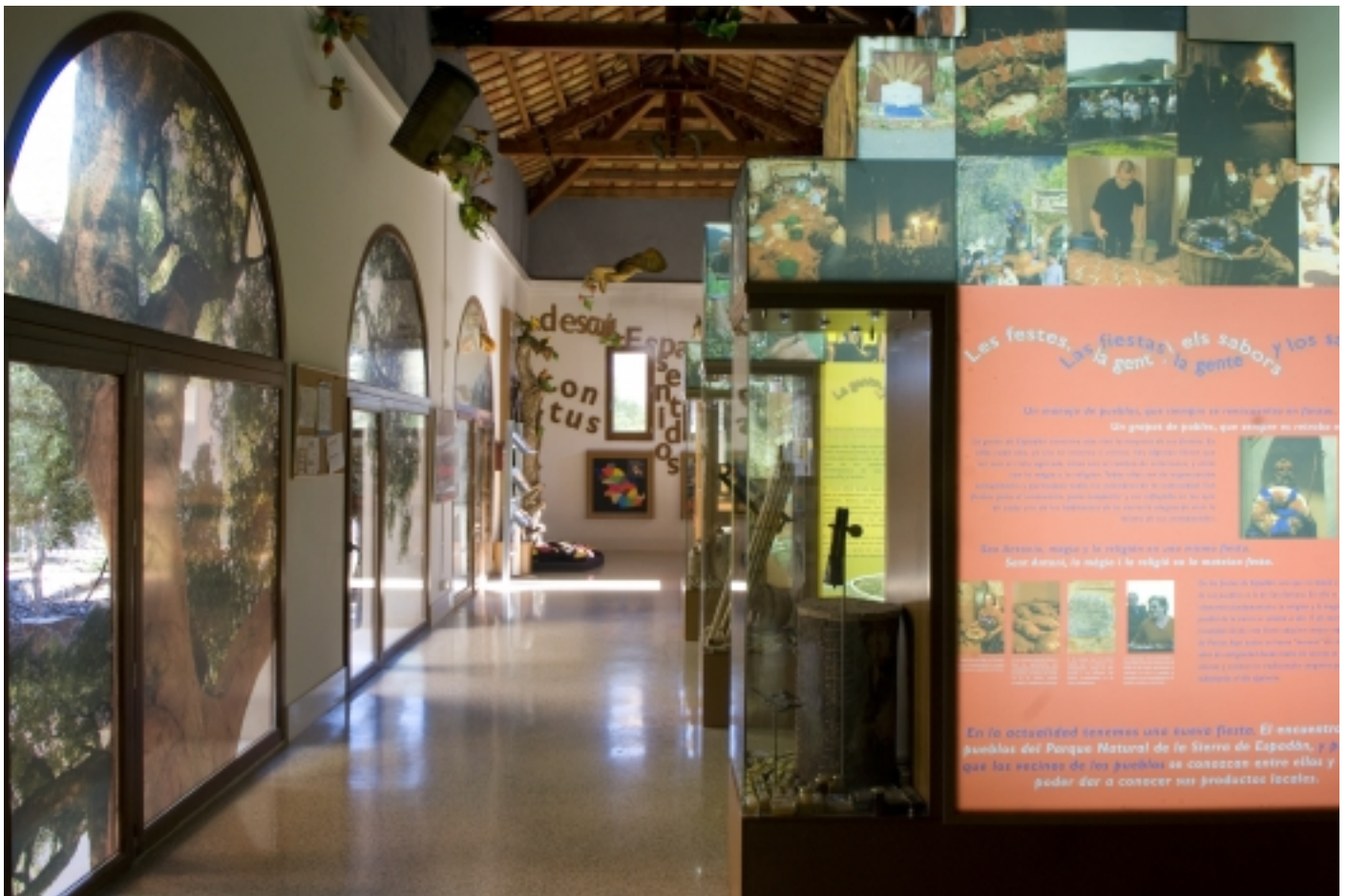
Exposició de recursos.