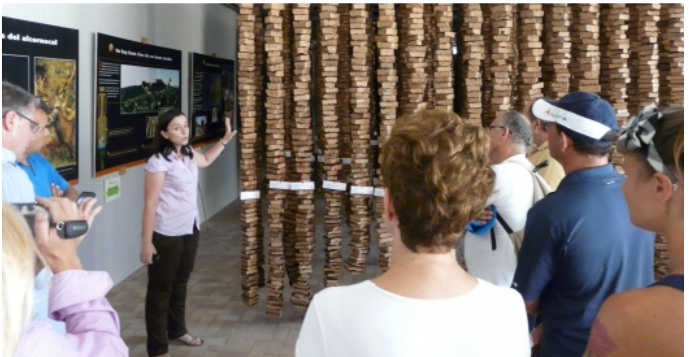
Visita guiada.