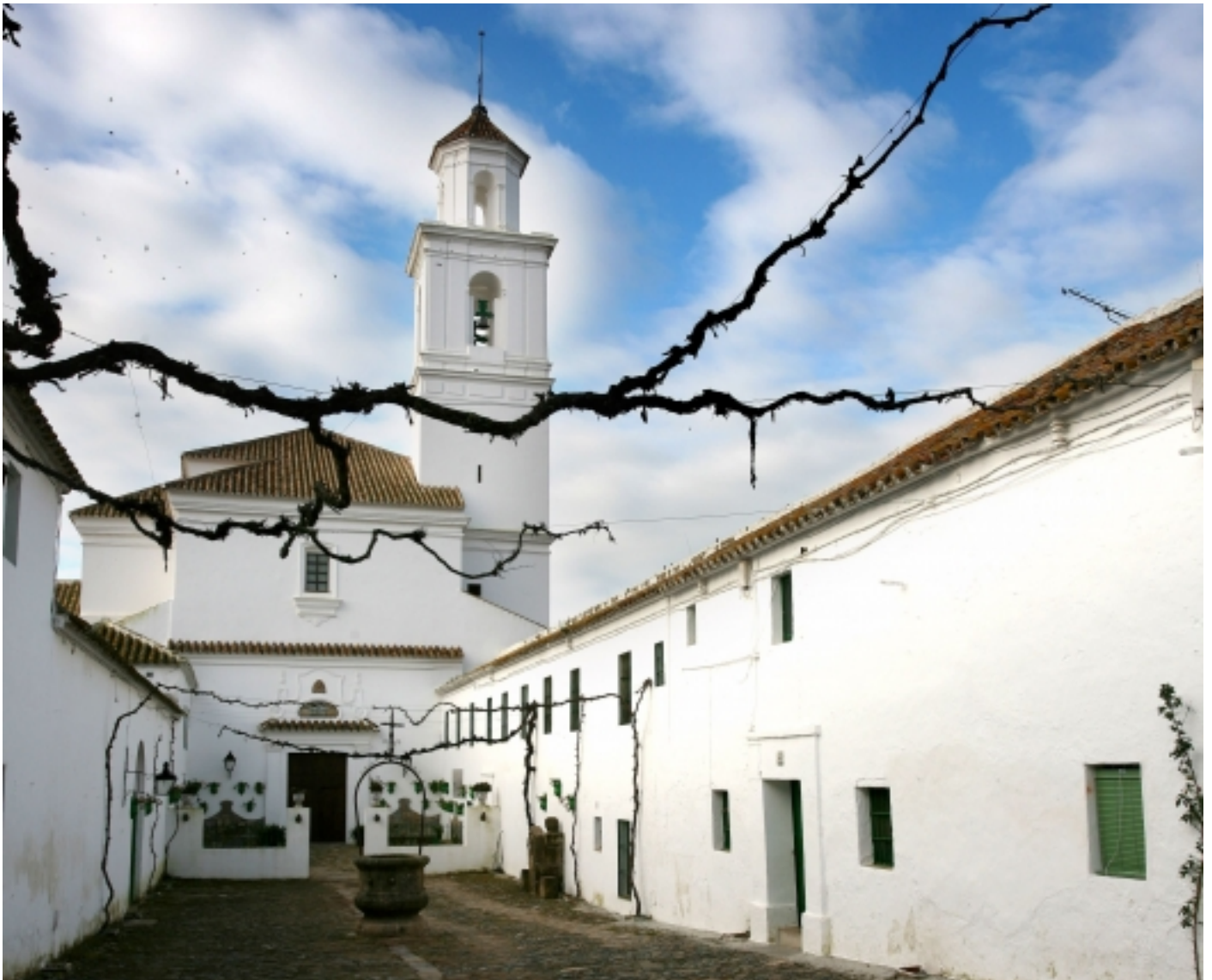
Poblat de San Calixto.

El nucli urbà conserva l'estructura de poblat àrab, amb carrers empinats i estrets. El sector primari és el més important, però el flux de visitants que genera el Parc i l'activitat cinegètica han propiciat l'aparició de serveis turístics, especialment, allotjaments rurals.