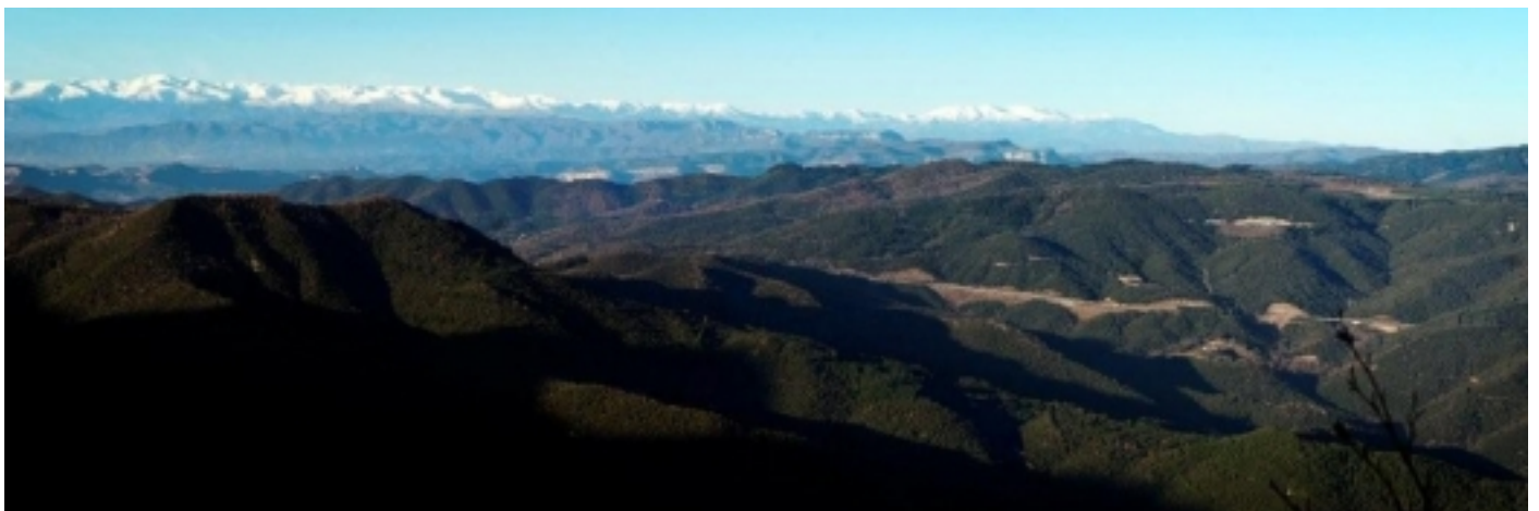
Panoràmica del Montseny.

La coincidència d'aquests ambients tan diversos en un territori relativament reduït explica que el Montseny albergui la diversitat faunística més important de tota la regió , amb més de 200 espècies de vertebrats i unes 9.000 espècies d'invertebrats.