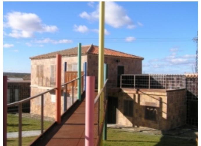
Museu de Terrisseria i Arqueologia.

Acompanyament d'aquestes saboroses carns és un bon vi de Toro, o de la zona dels Arribes , que poc a poc es va fent forat a les taules.