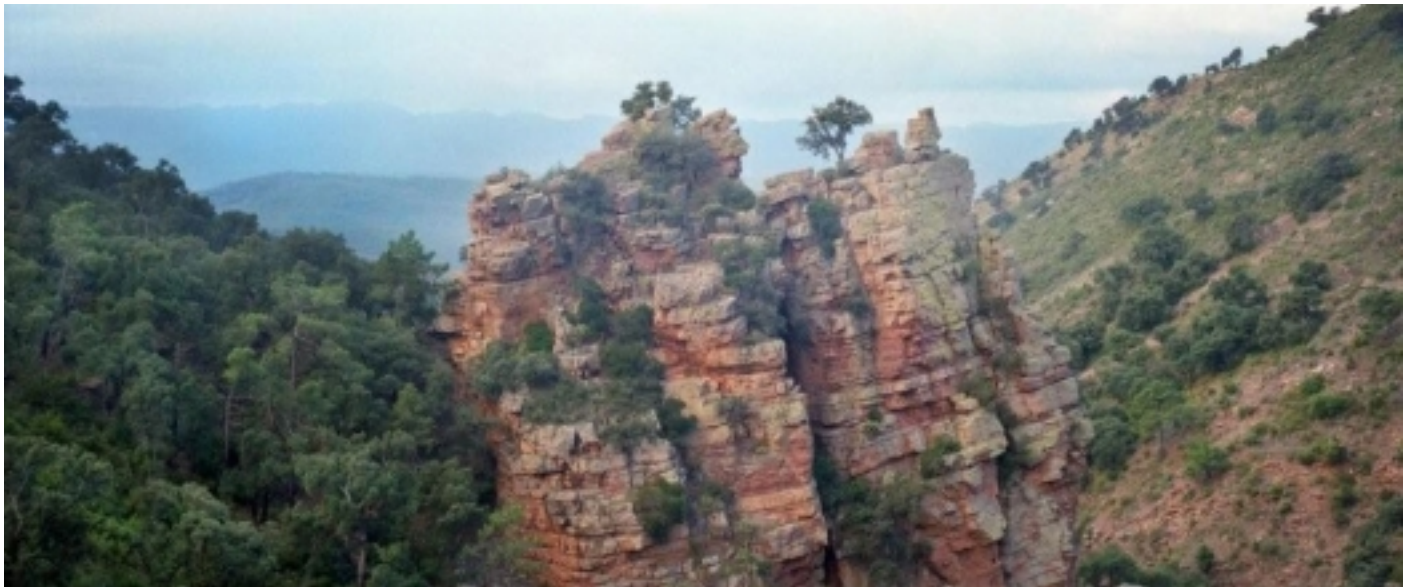
Parc Natural de la Serra d'Espadà, barranc d'Ajuez.

Podran trobar punts d'informació col·laboradors a Segorbe, Montanejos, Chilches, Onda, Castelló de la Plana, Navajas, Moncofa, Almenara i Almassora.