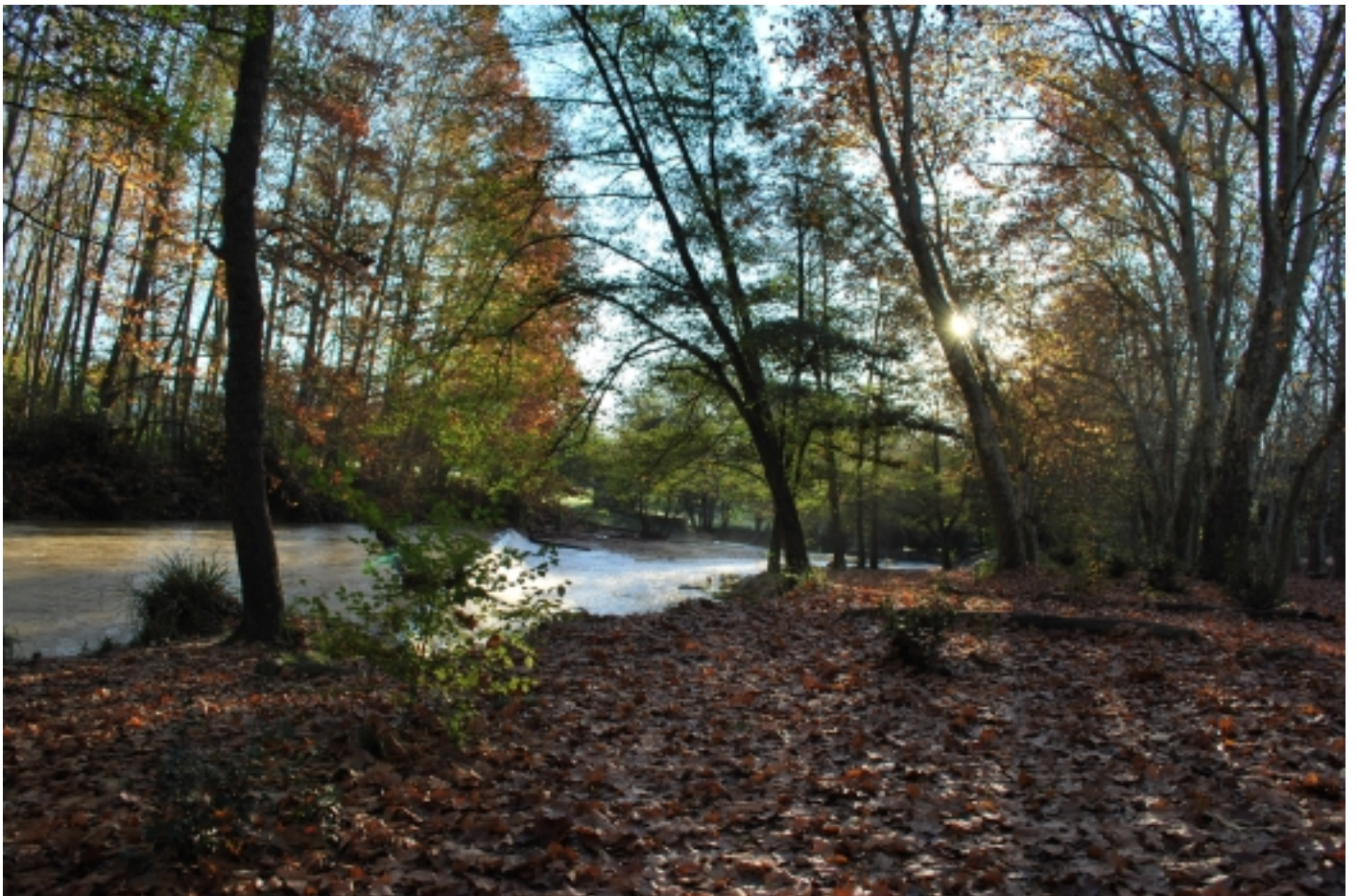
Parc de Sant Salvador, Santa Coloma de Farners.

Tot això fa de la ciutat un destí de repòs i tranquil·litat.