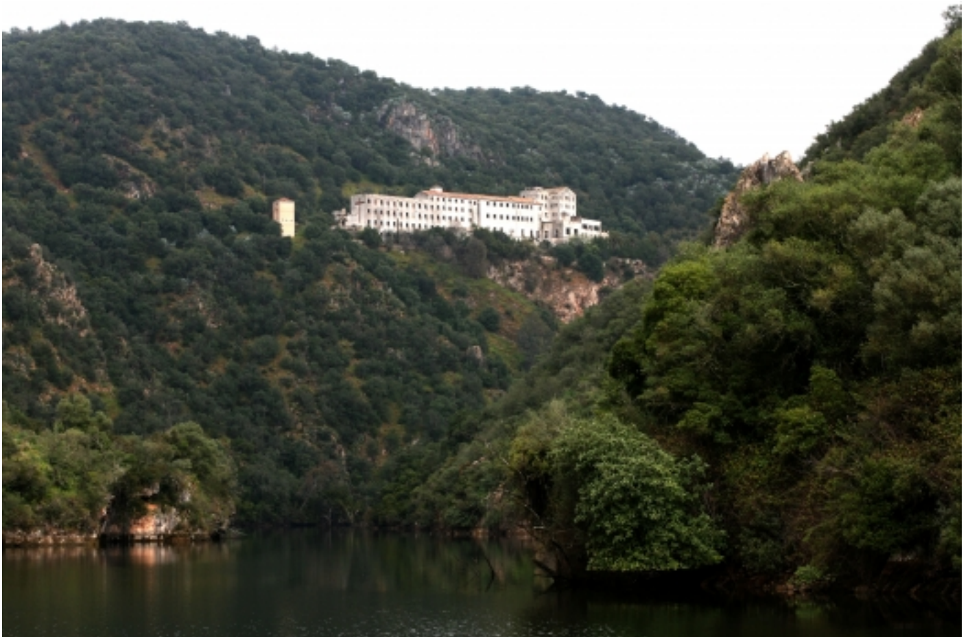
Seminari, Hornachuelos.

Juntament amb la Sierra Norte de Sevilla i la Sierra de Aracena i Picos de Aroche, conforma la Reserva de la Biosfera Deveses de Sierra Morena.