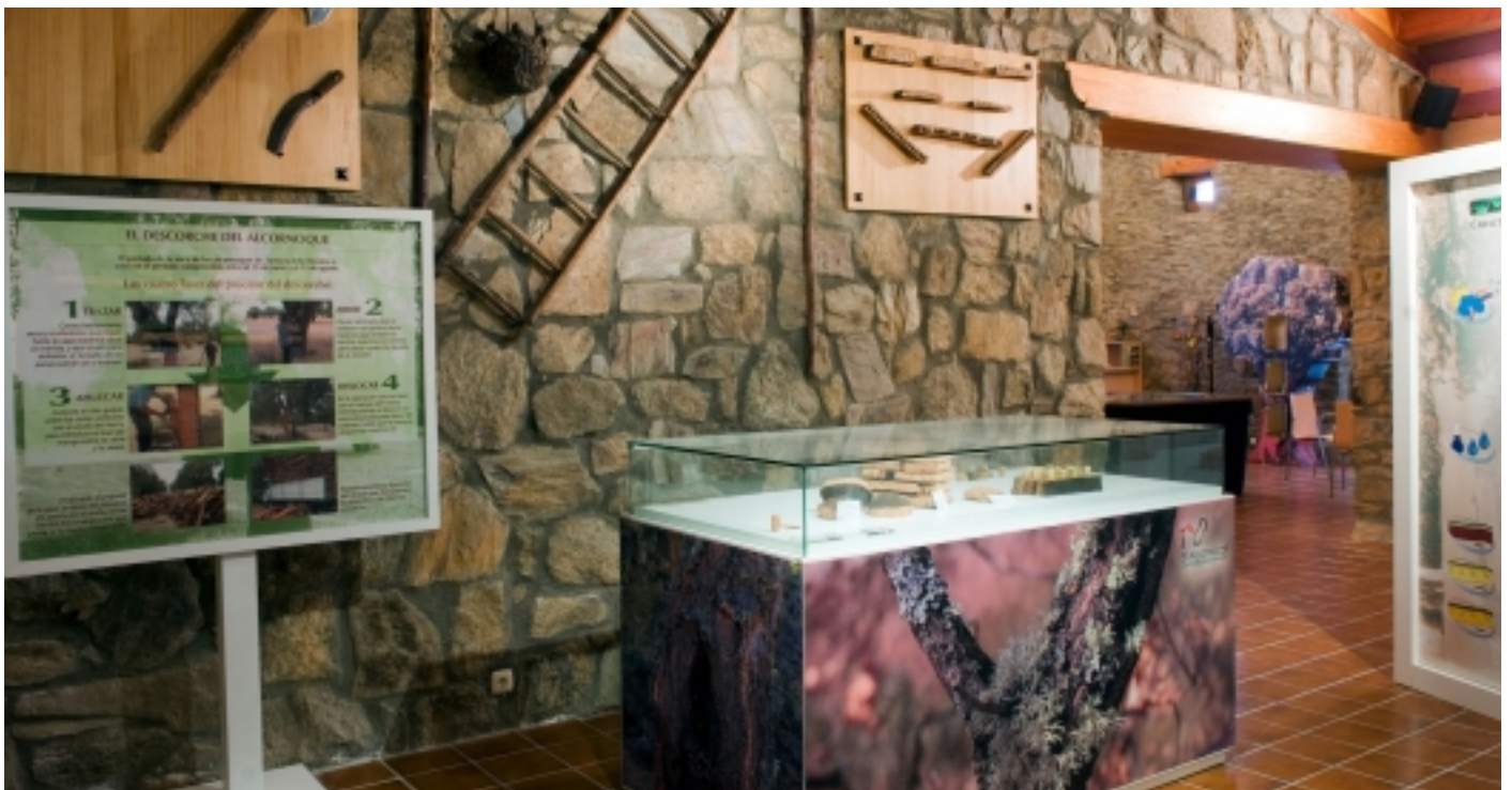
Col·lecció sobre l'alzina surera i el suro.