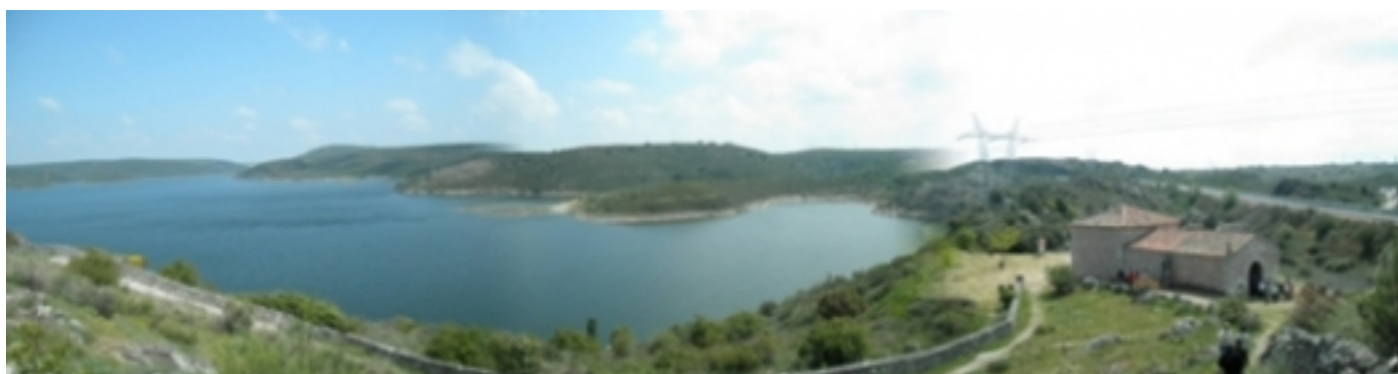
Platja de Ricobayo de Alba.

C. Sillada 8 49167 Muelas del Pan, Zamora citamuseos@ayto-muelasdelpan.com www.ma-am.es