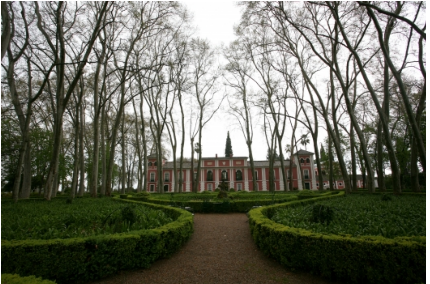
Palau i Jardins de Moratalla.

turismo@hornachuelosrural.com www.hornachuelosrural.com