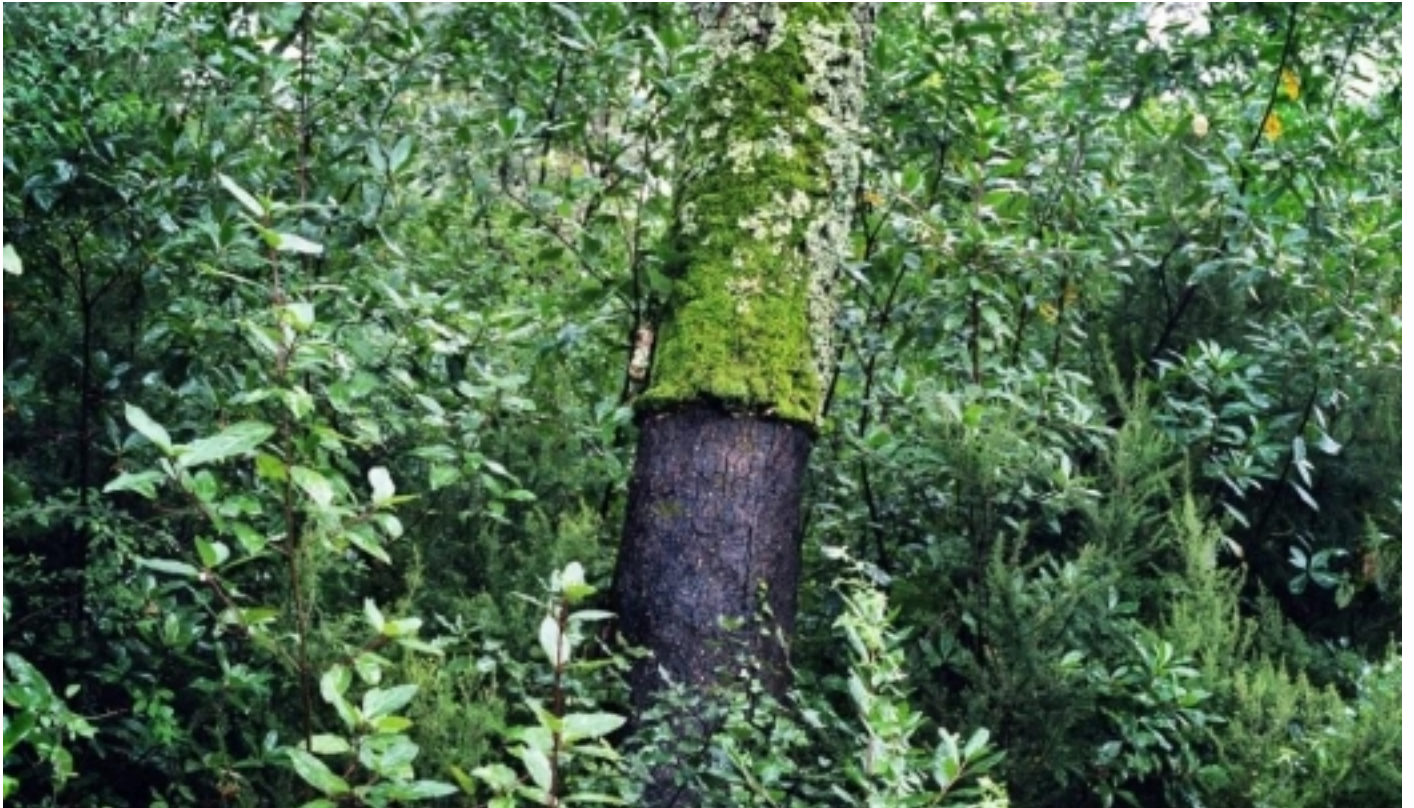
Parc Natural del Montseny, Fogueres de Montsoriu.

Fonts: Informació facilitada per ACER. Associació per a la Conservació de l'Entorn i la Recerca; i extreta de www.turisme-montseny.com , www.gencat.cat , http://parcs.diba.cat i Viquipèdia.