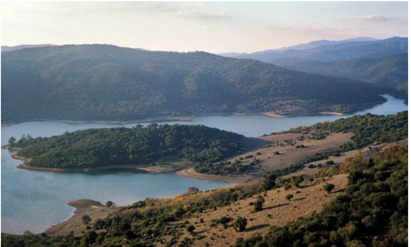
Parc Natural de Los Alcornocales. Castellar de la Frontera, embassament de Guadarranque.