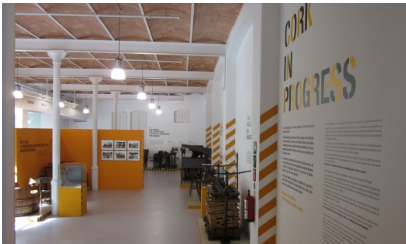
Espai expositiu.

Aquest conjunt monumental és el testimoni de l'ocupació d'un indret privilegiat. Es pot visitar un jaciment ibèric (segles VI a I a.C.), una torre de guaita del segle XV, una ermita i hostatgeria del segle XVIII i el far del segle XIX. Tot això al cim d'una muntanya amb penya-segats sobre el mar i amb una de les millors panoràmiques de la Costa Brava.