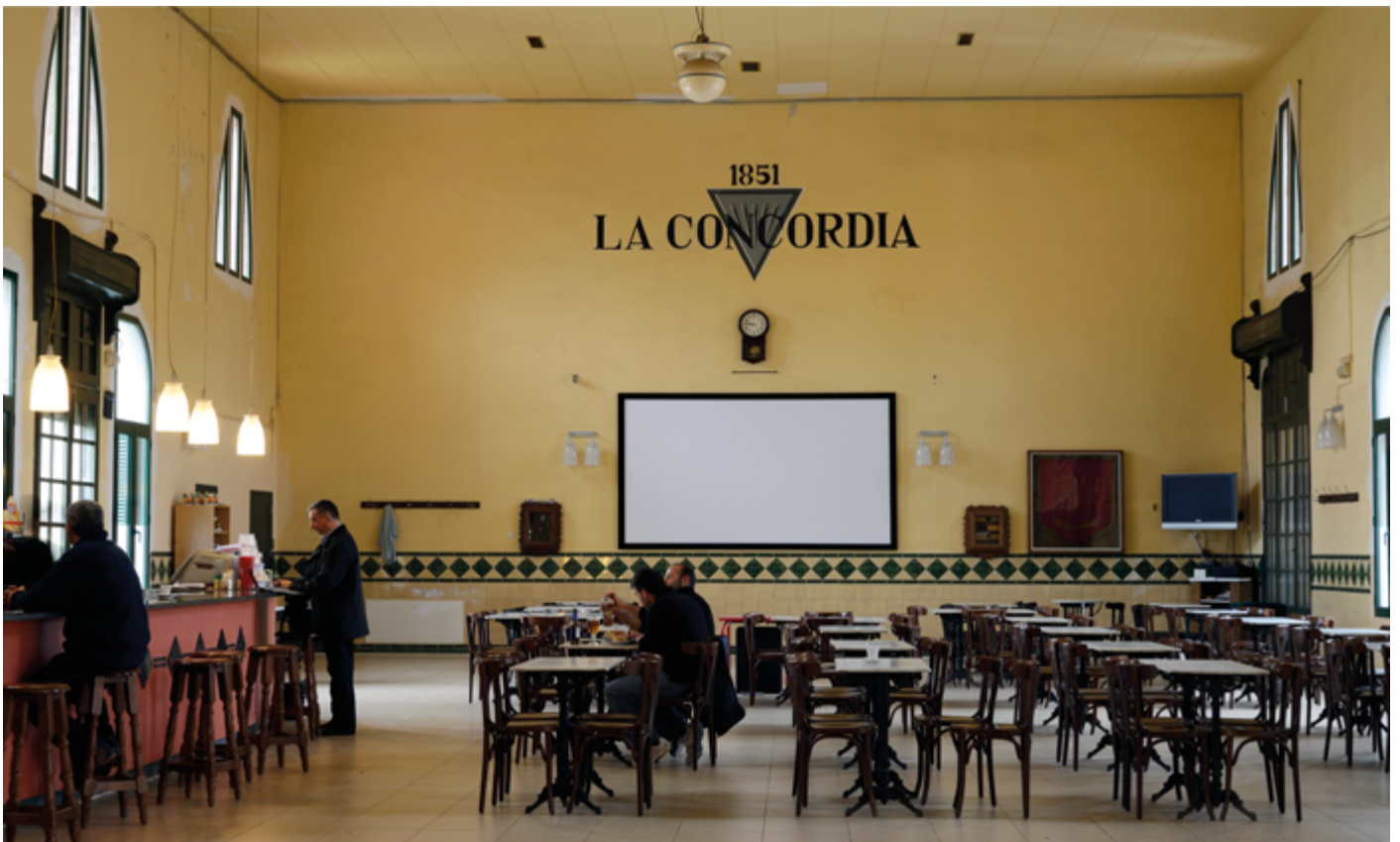
La Concòrdia, Agullana.