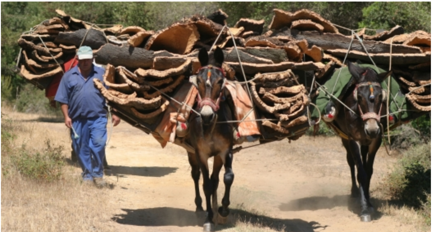
La pela del suro i les tasques de traginaria.

Santa i la solta del toro embolao . En quant a gastronomia, les milfulles, la merenga o els piononos d'ametlla són només una mostra de la rebosteria artesanal que es pot degustar. El més típic del municipi és la sopa de tomàquet a l'estil de Los Barrios , la moruna i els chicharrones gibrells, sense oblidar la frita de peix variat o les sardines a l'etzibo .