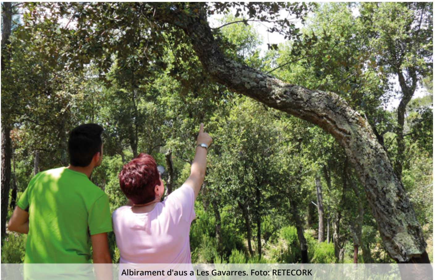
Albirament d'aus a Les Gavarres.