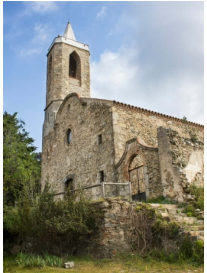
Hortsavinyà, Tordera.

A la zona del Montnegre, on les comunicacions han estat sempre més difícils, s'enclaven parròquies aïllades o ermites en els indrets més elevats.