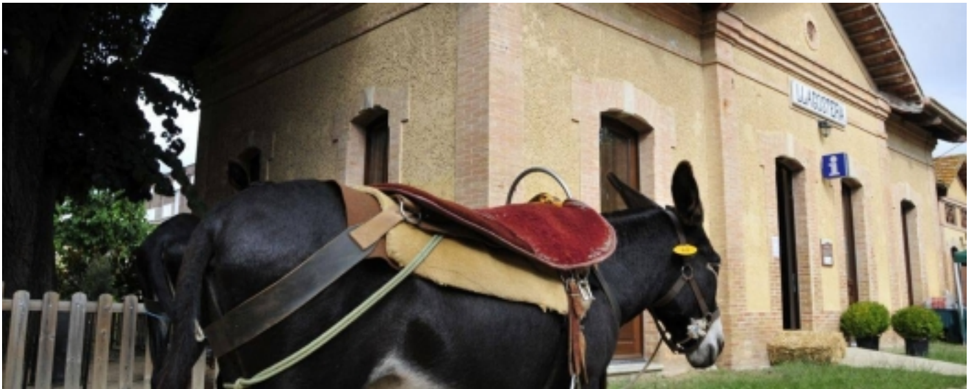
Antiga estació El Carrilet. Actualment és el punt d'informació.