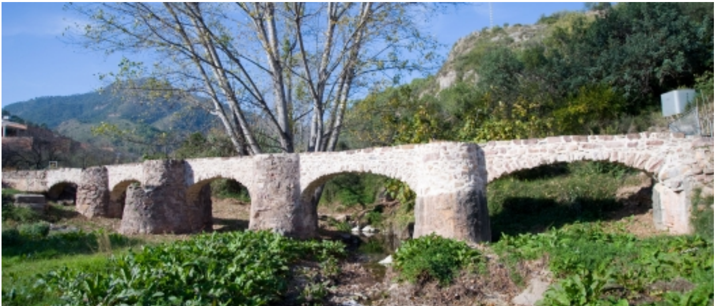
Aqüeducte de la Rambla, Eslida.

D'altra banda, i més relacionat amb el patrimoni històric , no deixeu de conèixer l'Aqüeducte de la Rambla, el Molí d'Aire i les alqueries dels Corral i l'ermita del Calvari.