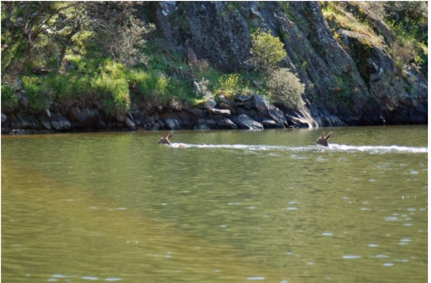
Cérvols creuant el riu Tajo, Parc Natural Tajo Internacional.

La principal formació vegetal del Parc és el bosc mediterrani. Hi abunden l'alzina, l'alzina surera, el garric, l'aladern de fulla estreta, l'arboç i varies espècies de brucs. De manera molt puntual trobem espècies d'influència atlàntica com el roure pènel, el freixe de muntanya o la flor de Rocío, aquesta última amb escassos exemplars.