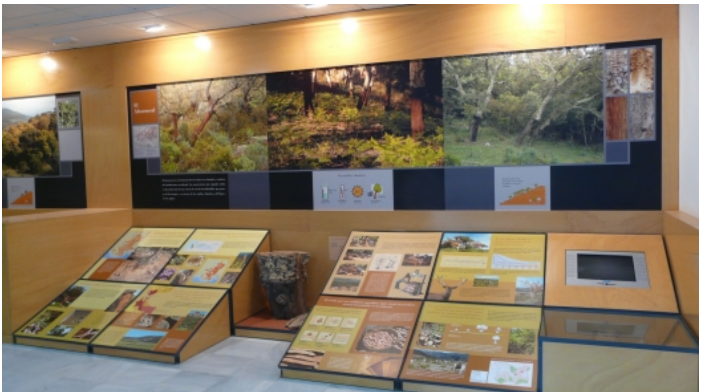
Plafons informatius del Centre de Visitants.

De les dues sales principals, la primera tracta sobre la relació de l'home amb el bosc, amb especial atenció a l'aprofitament surer; a la segona s'exposen els principals ecosistemes, destacant la sureda com l'eix central de la mostra.