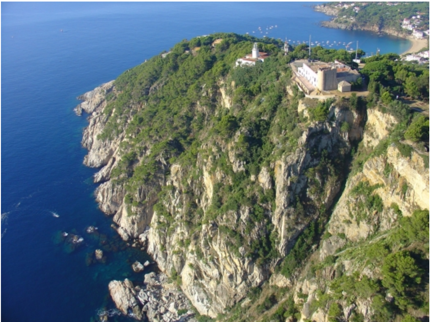
Far de Sant Sebastià.

En aquesta època es construeixen edificis emblemàtics com Can Mario. Posteriorment, el turisme es convertí en el seu principal motor econòmic.