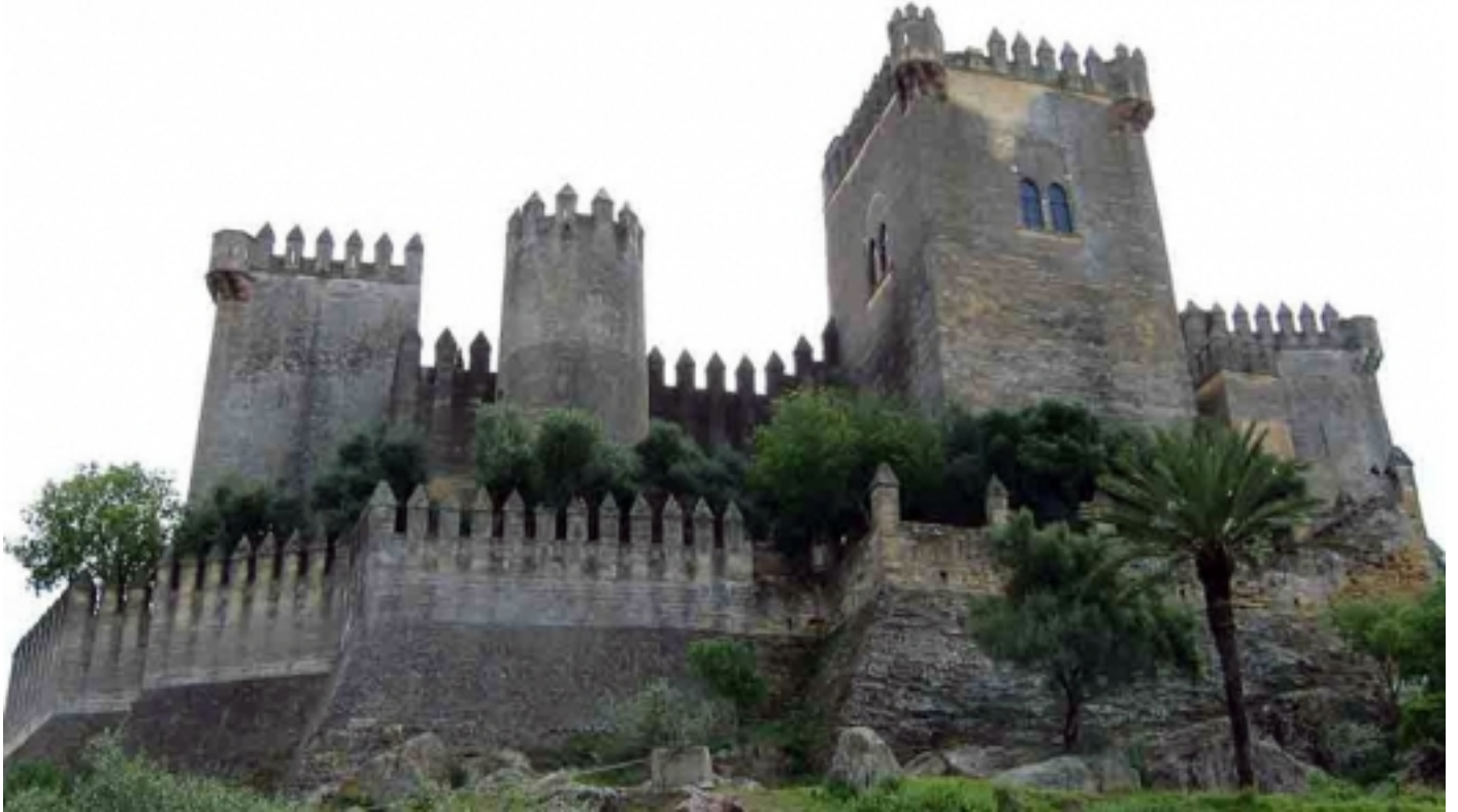
Castell de la Floresta, Almodóvar del Río.