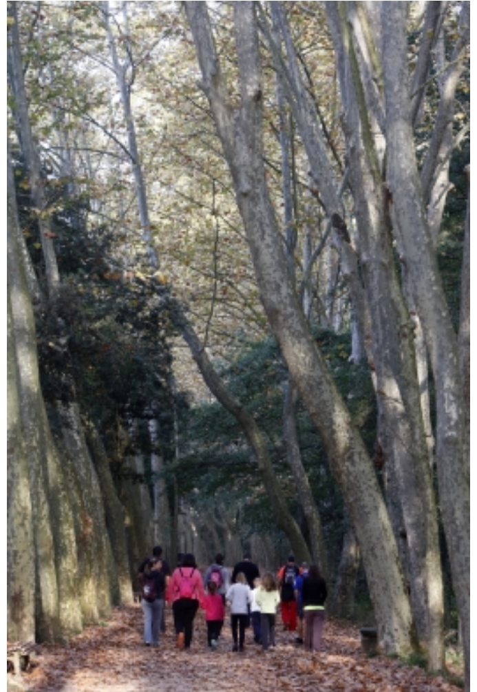
Parc de Santa Coloma.

D'altra banda, també podeu conèixer la història de les famoses Galetes Trias o visitar el Museu Casa de la Paraula.