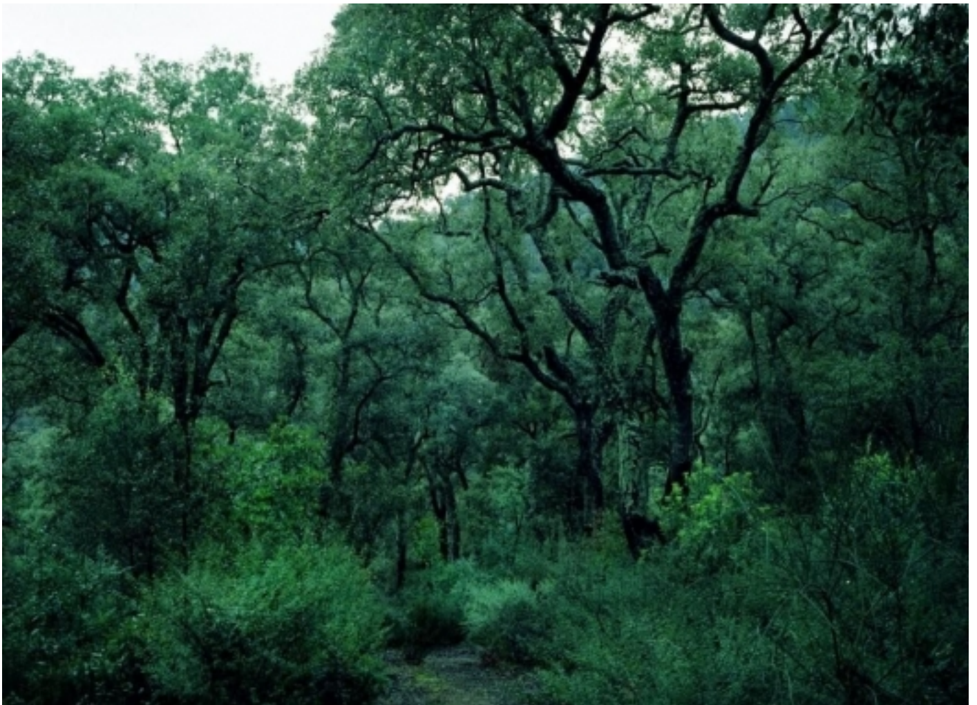
Parc Natural del Montseny.

Molts dels hàbitats representats en aquest Parc són d'interès comunitari, com els alzinars, pinars mediterranis, suredes, fagedes, castanyers i landes. A més de l'extraordinària biodiversitat, el Montseny acull un patrimoni cultural i etnològic de gran valor. La superfície protegida del Parc és de 31.064 hectàrees. El 1978, la UNESCO va incloure el Montseny a la Xarxa Mundial de Reserves de la Biosfera i el 2004 va obtenir la Q de Qualitat; aconseguint el 2011 l'acreditació de la Carta Europea de Turisme Sostenible.