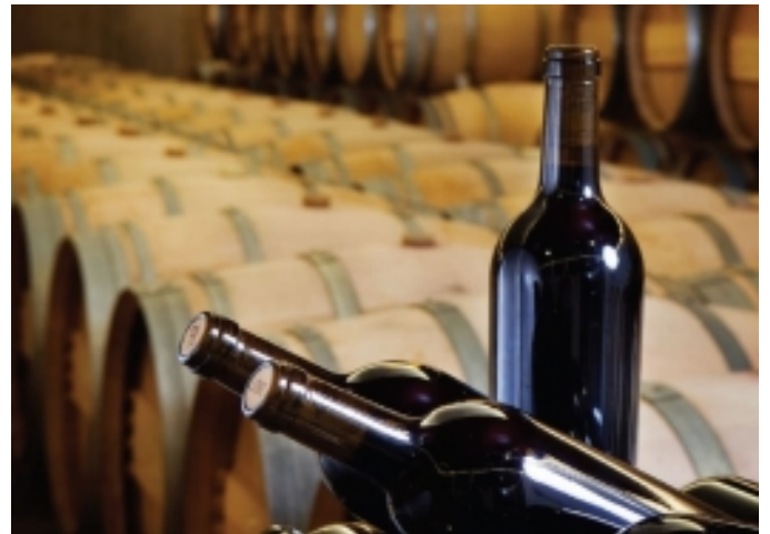
Visites a bodegues.

El turisme enològic està realment implantat en aquests territoris i a través de rutes enològiques, tallers, degustacions i visites a bodegues i vinyers , es descobreix una riquesa gastronòmica, cultural i, perquè no, de salut i bellesa, mitjançant la vinoteràpia, sense igual.