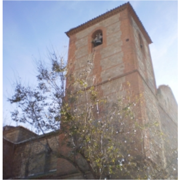
Església Parroquial de San Miguel Arcángel.

Si us interessa el patrimoni històric, no dubteu en recórrer els carrers del municipi on trobareu la Casa Consistorial, l'Església de San Miguel Arcángel, les Cases Porxades, ermites, així com les restes del Castell de Dos Hermanas.