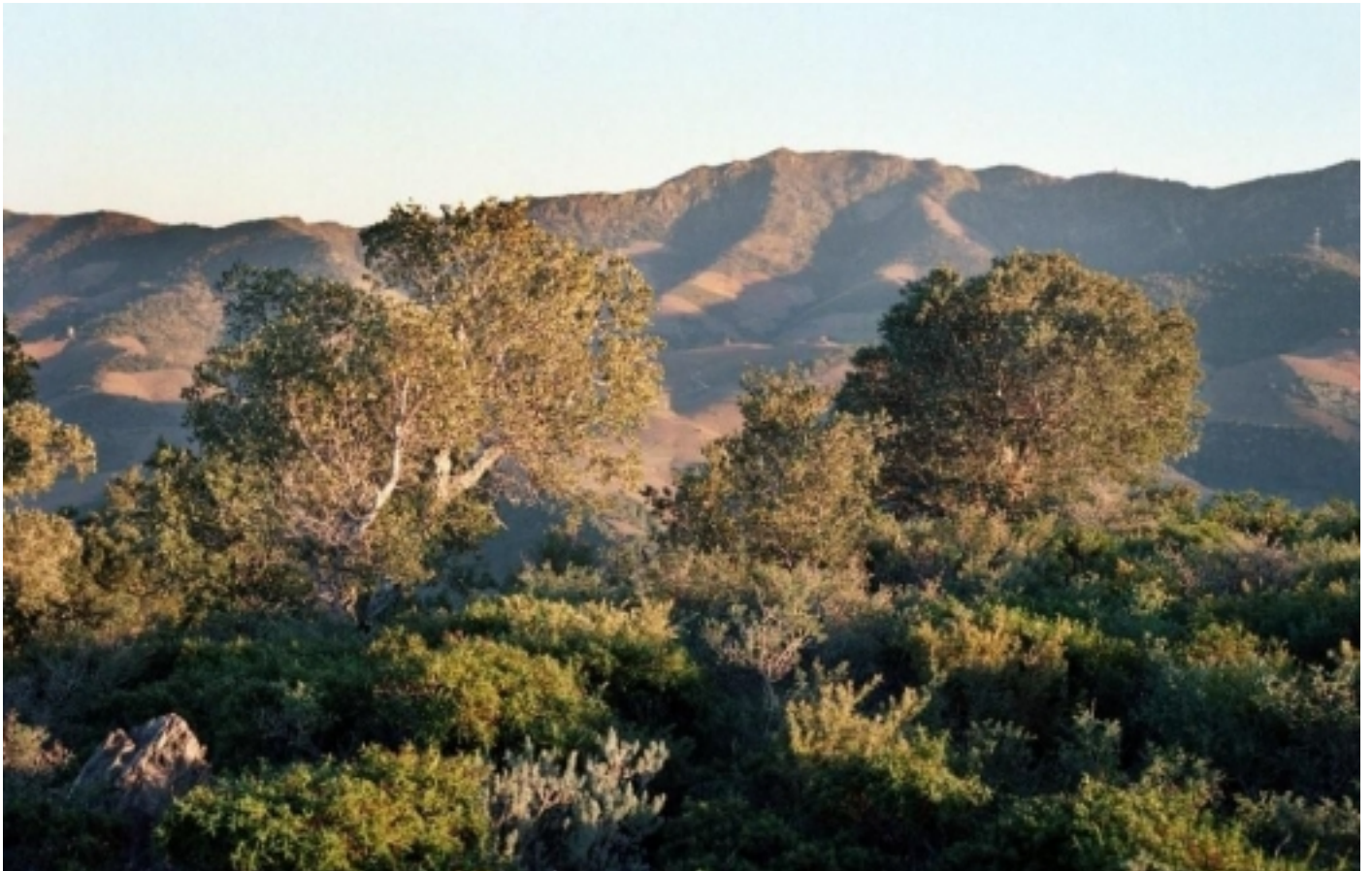
L'Albera, Banyuls.

Posteriorment, s'estableix la creació de dues reserves parcials en el si del Paratge: la Reserva Natural Parcial de la capçalera del riu Orlina , de 384 ha, amb la finalitat de preservar la flora , especialment la fageda; i la Reserva Natural Parcial de la Vall de Sant Quirze , de 585 ha, per a la protecció de la tortuga mediterrània.