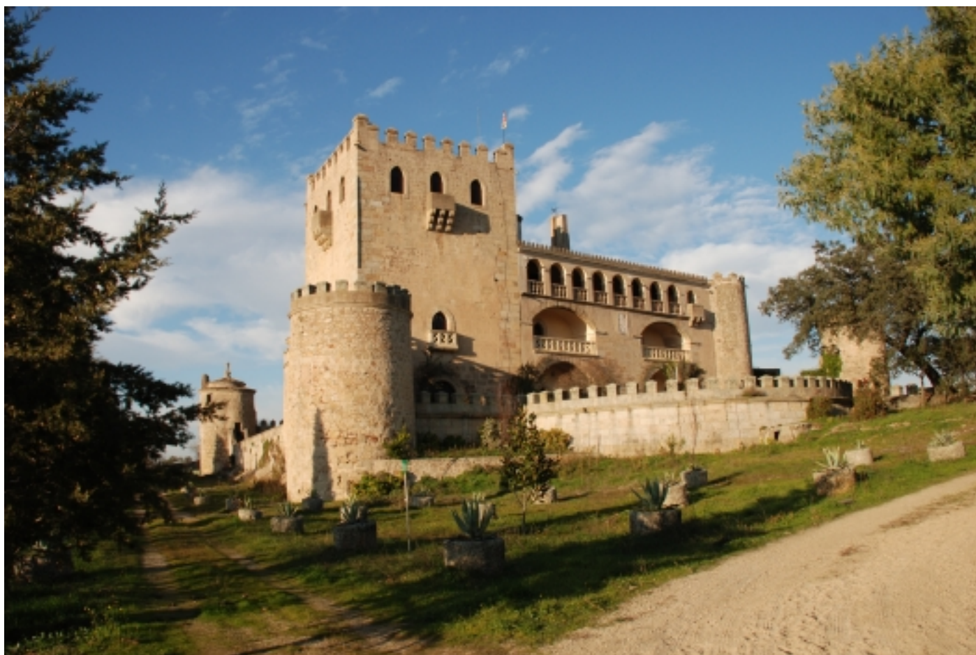
Castell de Piedrabuena, San Vicente de Alcántara.

San Vicente és considerada la ciutat del suro , on existeix la major concentració d'indústries transformadores del material, i part de la seva cultura i festes giren al voltant d'aquest.