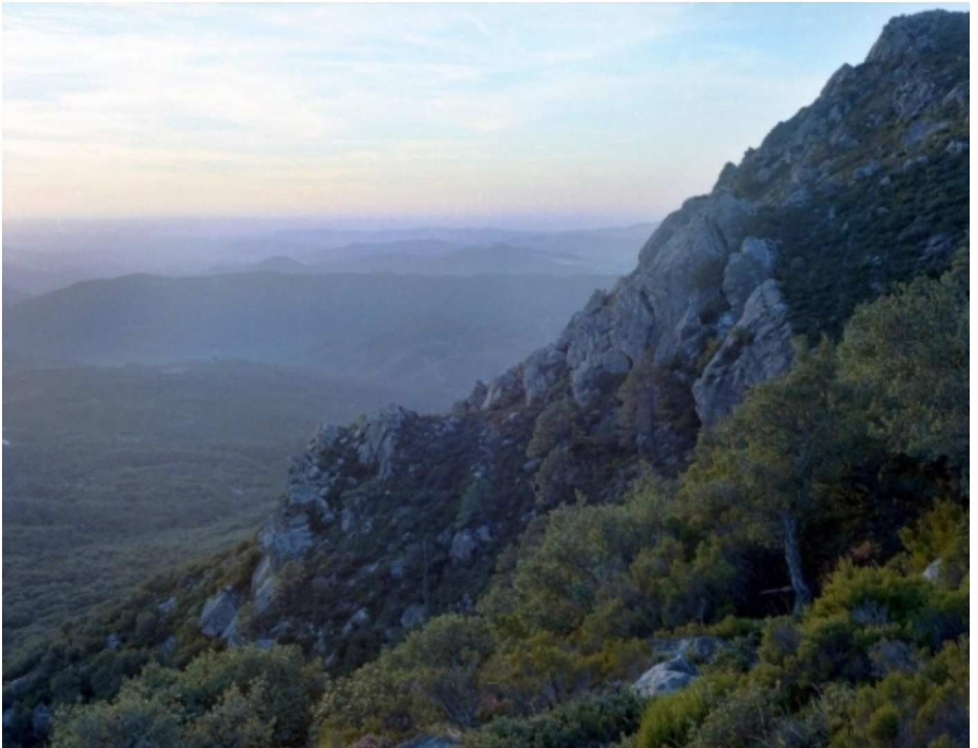
Parc Natural de Los Alcornocales. Alcalá de los Gazules, El Picacho.

La superfície protegida és de 167.767 hectàrees i les seves masses de sureda han estat catalogades entre els principals boscos residuals comunitaris, així com la seva riquesa biològica.