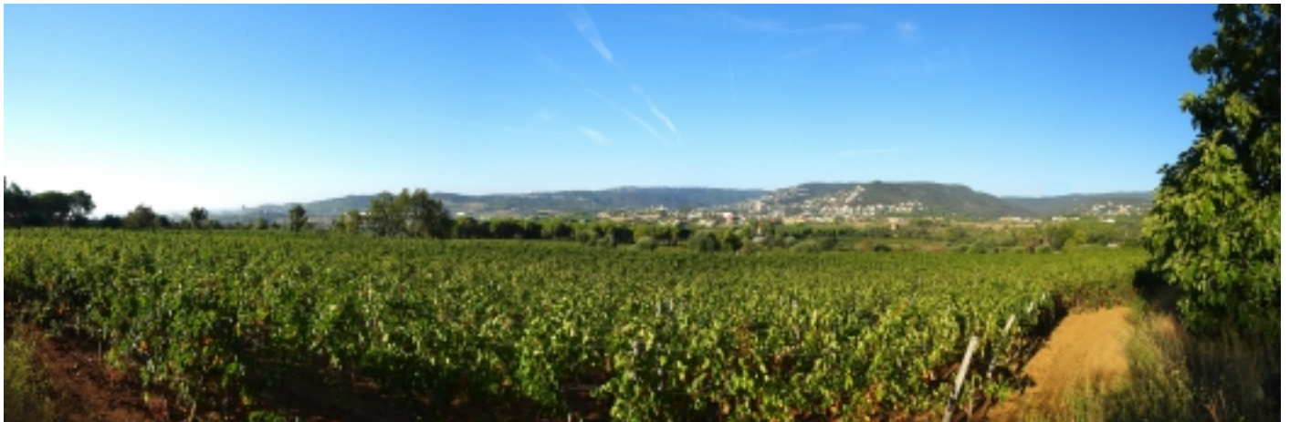
Vinyes a la Conca del Tinar de Calonge.

D'altra banda, la seva gastronomia és fruit de la fusió de cuina de mar i muntanya. Les tres campanyes gastronòmiques de més prestigi són el Menú de l'Olla de Peix , el Menú de la Gamba i el Menú de l'Escamarlà .