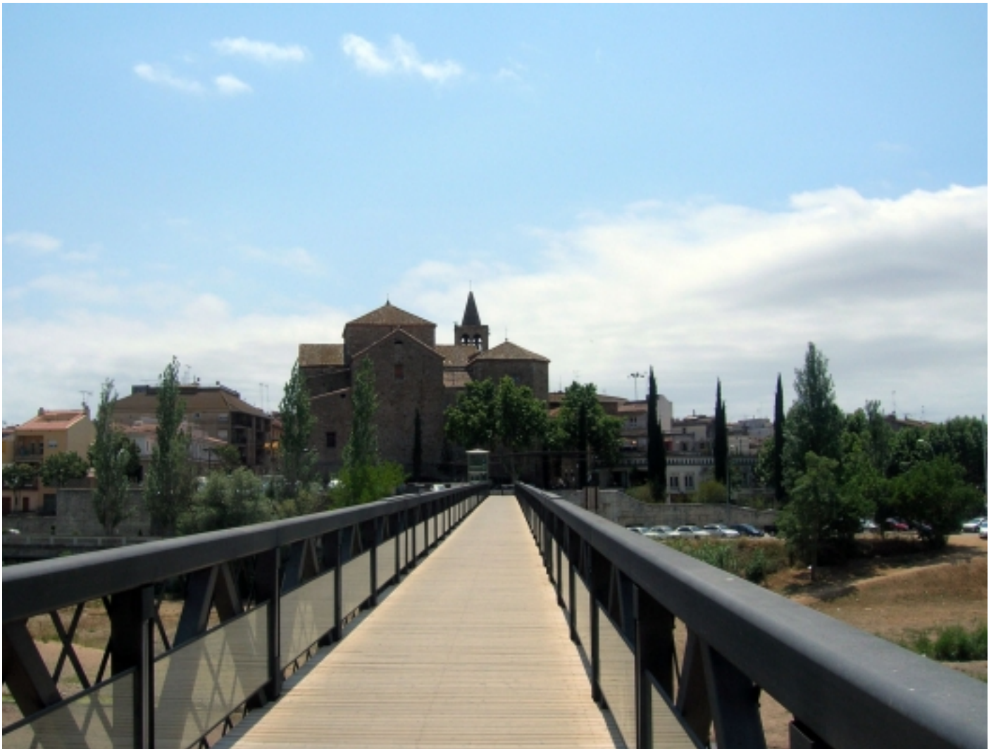
Pont de ferro, Tordera.

Durant segles, l'agricultura va ser la forma de vida a Tordera, fins l'arribada de la indústria suro tapera, un dels primers elements d'industrialització, que es va veure afavorida per la presència del riu. Actualment, el municipi gaudeix d'una gran activitat econòmica al trobar-se perfectament comunicat per carretera amb Barcelona així com amb la costa.