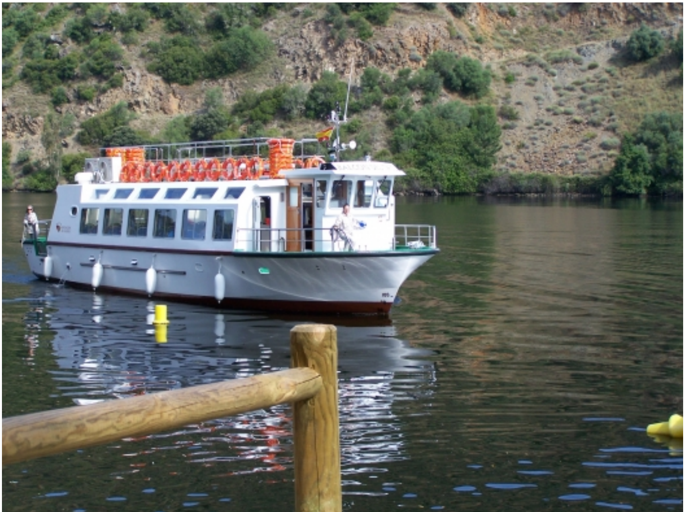
Vaixell turístic del Parc Natural Tajo Internacional.

En ell existeix una gran riquesa faunística , albergant espècies en greu perill d'extinció com l'àguila imperial ibèrica, el voltor negre, el linx ibèric, el gat salvatge, el llop ibèric, l'àguila daurada, l'àguila marcenca i el milà.