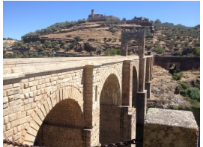
Pont d'Alcántara.

Una altra visita imprescindible és el conjunt monumental d'Alcántara, que gràcies a la ubicació de la seu de l'Ordre d'Alcántara, va convertir el municipi en un centre cultural, econòmic, religiós i administratiu.