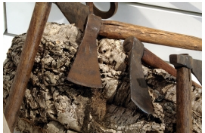
Destrals de pelar. Detall de l'àmbit de El suro. Una espècie amb avantatges.

Visites guiades Exposicions temporals Tallers Demostracions