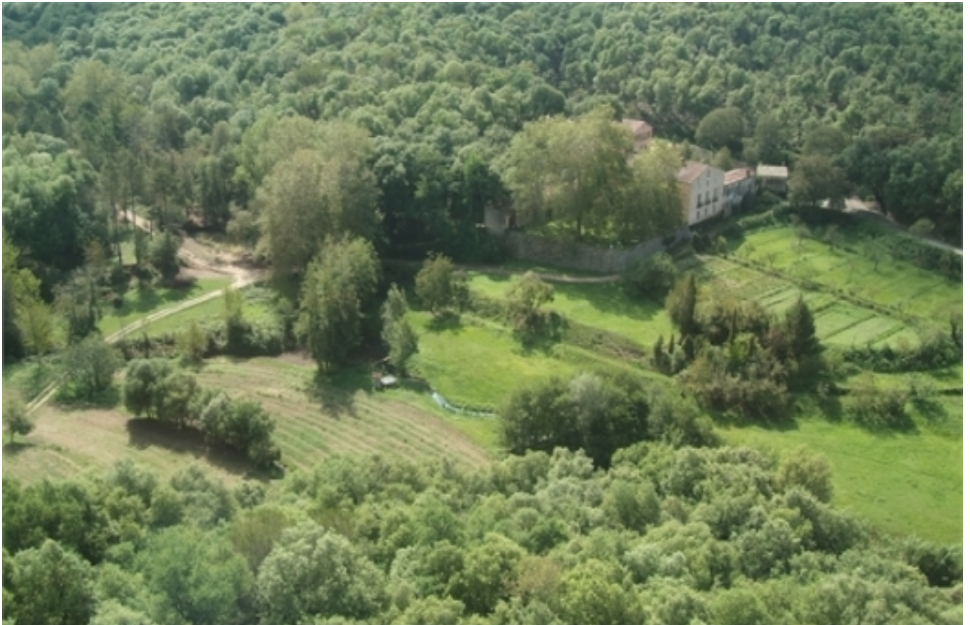
Mosaic agrari forestal.

La superfície de l'àrea protegida és de 15.010 hectàrees; d'elles, 2.241 són de sureda pura i 5.876 de sureda amb pi.